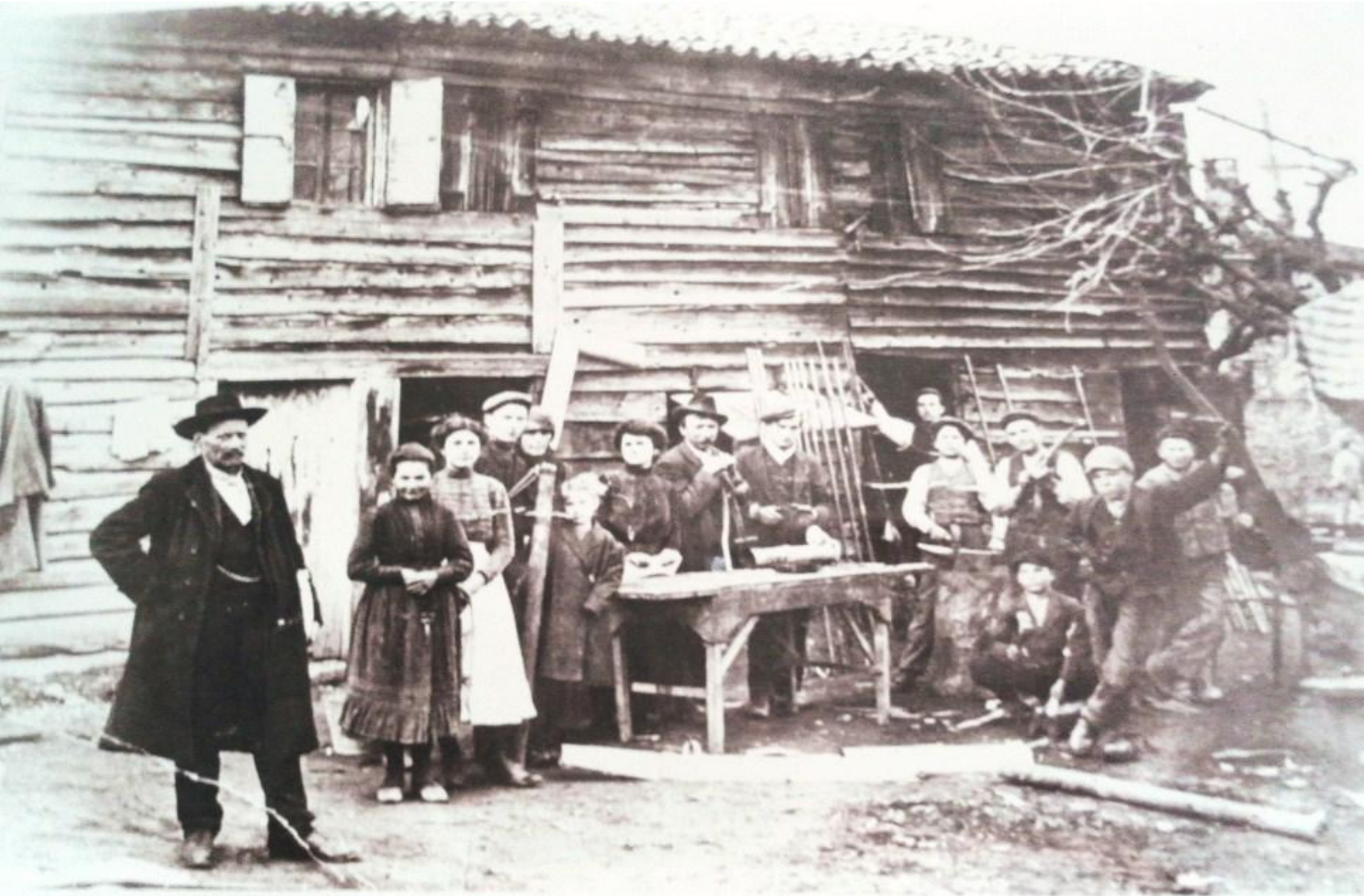
Famiglia Striuli in posa di fronte all'officina: a. d.1908.