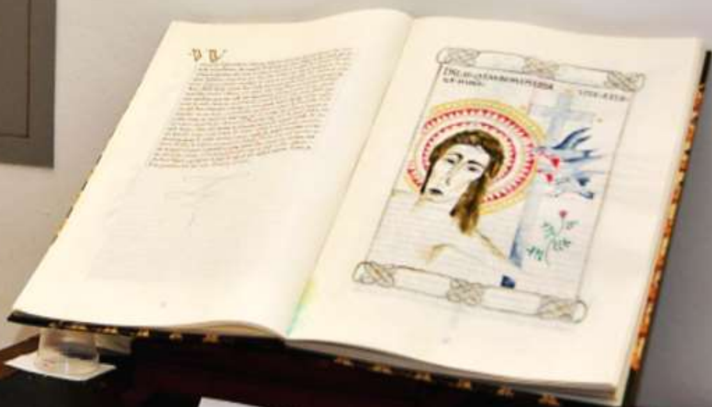
1000-1200 Incontro di Cristo