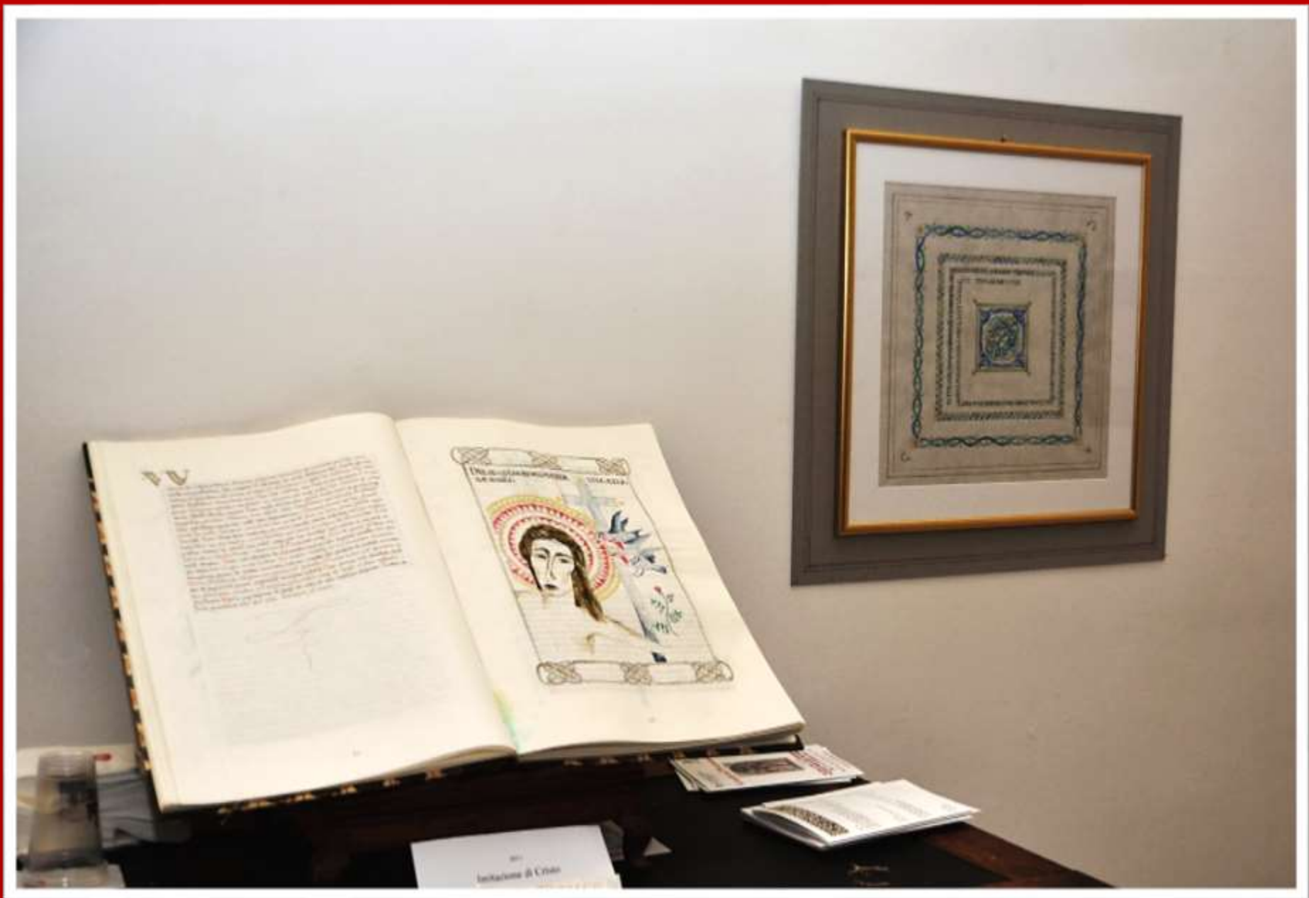
100 Invocazione di Cristo