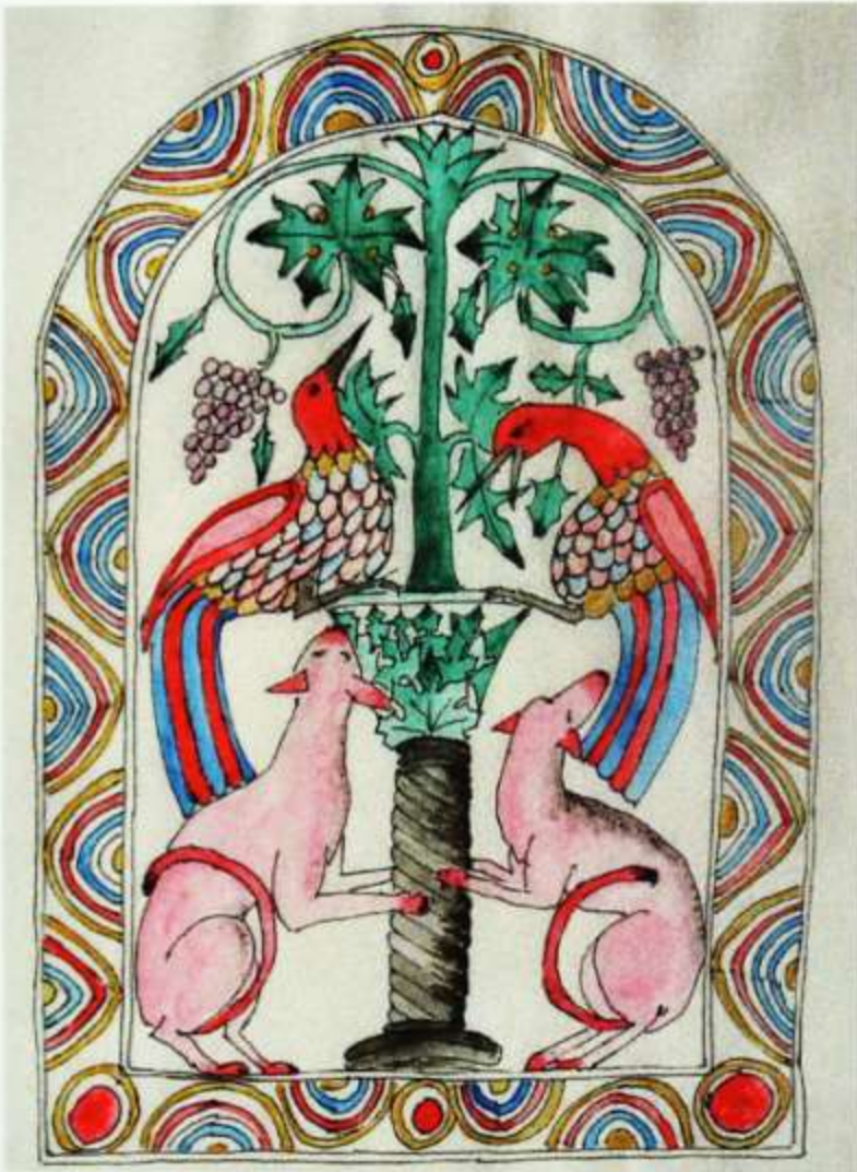
di Bruno Saran