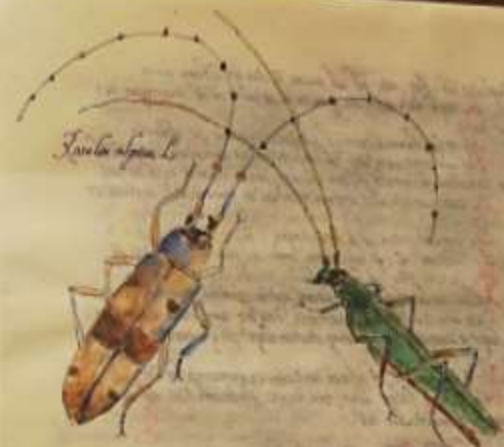
Tarbia alpina L.