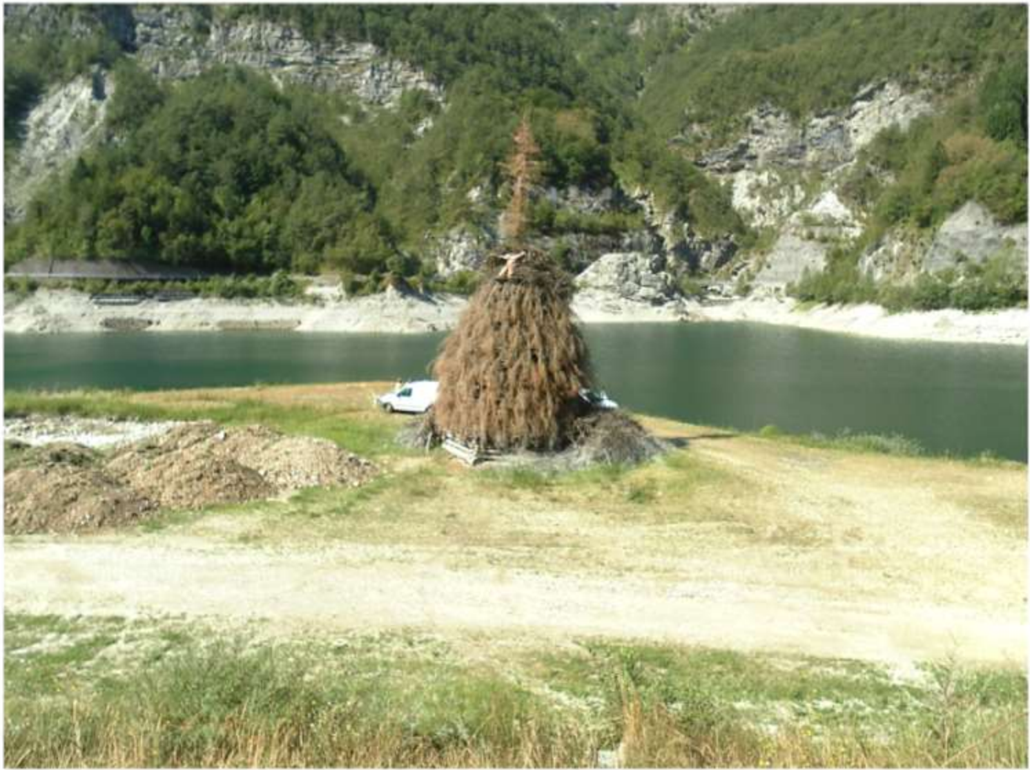
Il lago nel suo livello normale