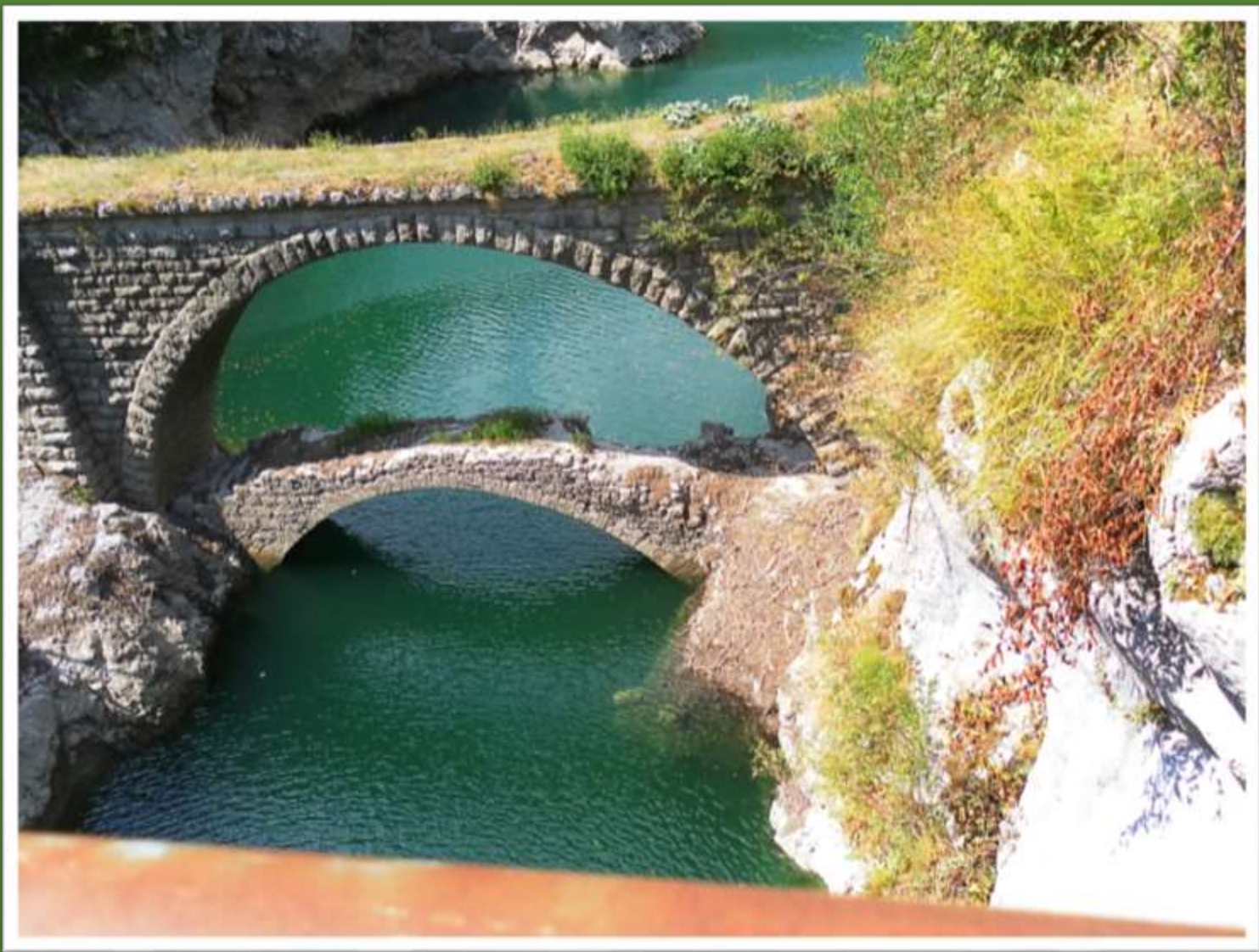
IL lago come si vede ora