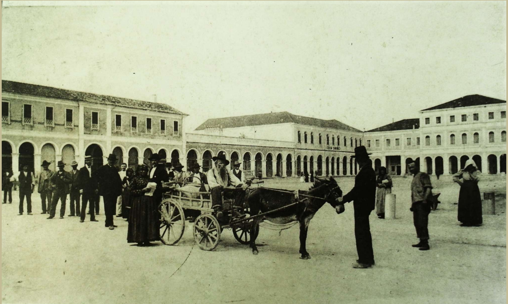
San Donà di Piave com'era la piazza Indipendenza alla fine del 1800