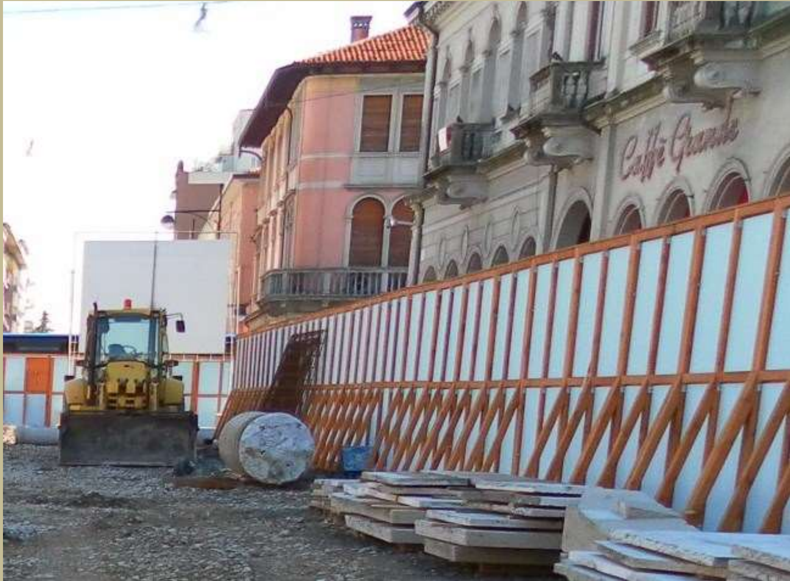
la colonna e lastre di travertino che foderavano il monumento