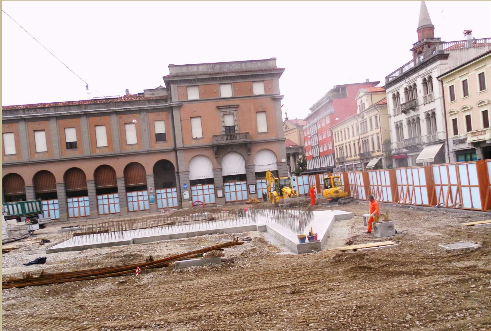
completata la base del monumento a Giannino Ancillotto