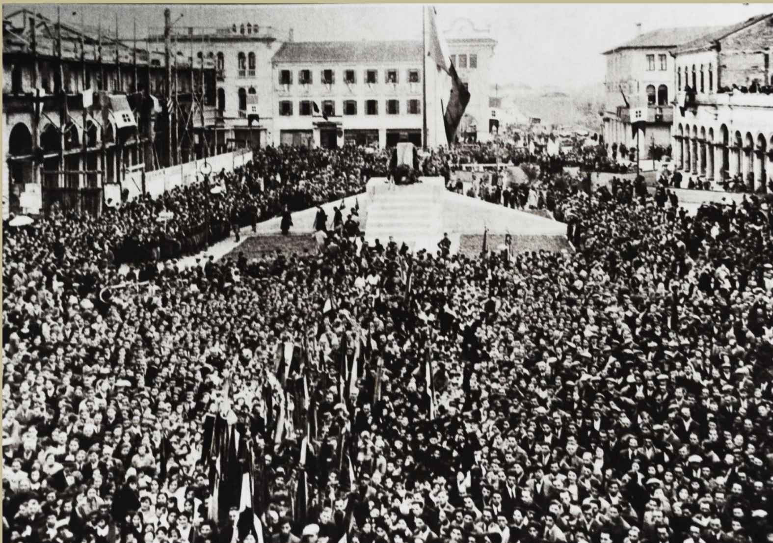
Archivio Fotografico club 54 San Donà di Piave piazza Indipendenza inaugurazione del monumento alla medaglia d'oro Giannino Ancillotto anno 1931