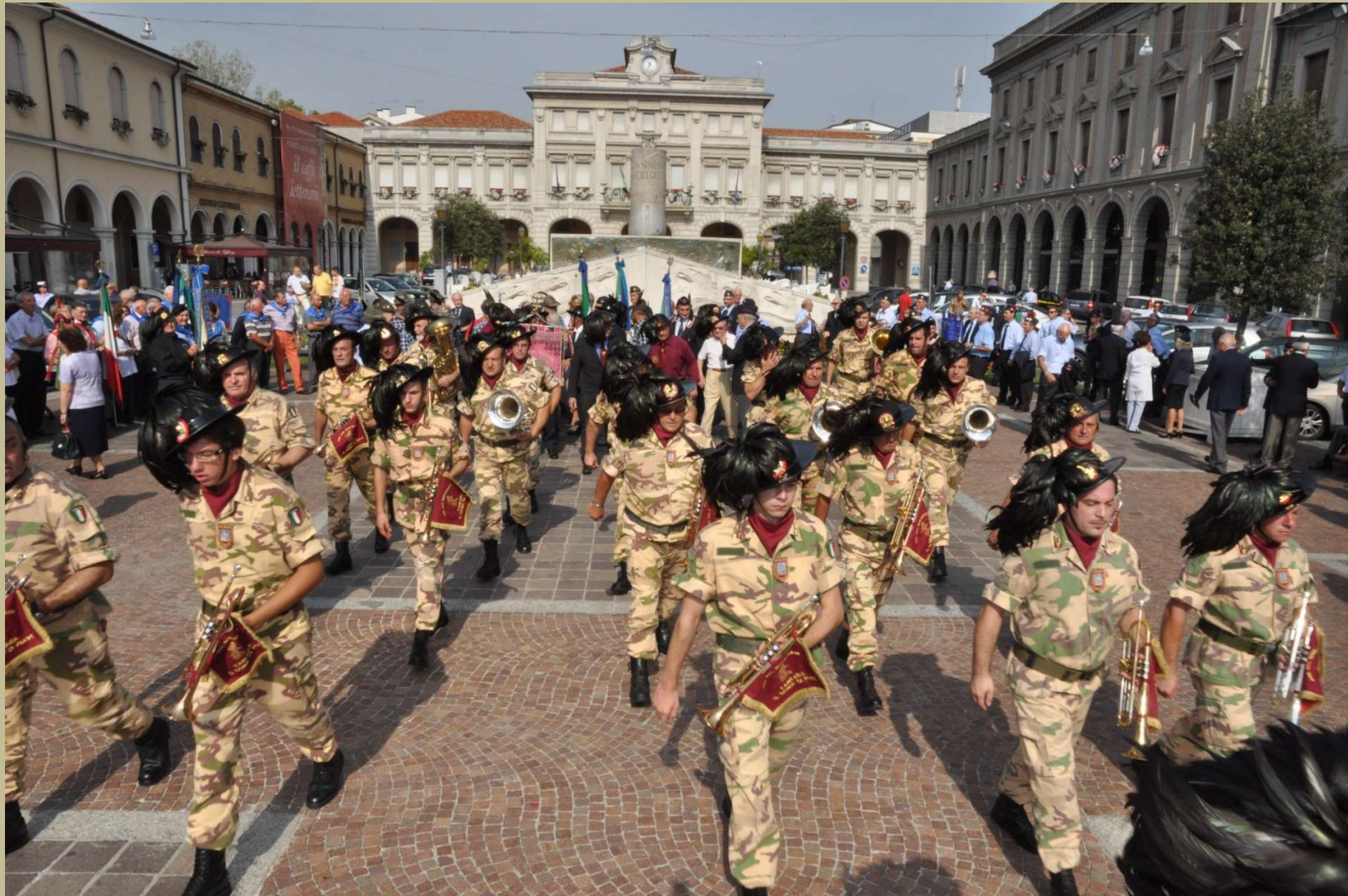
Archivio fotografico club 54 San Donà di Piave la fanfara abbandona la piazza Indipendenza dopo la foto ricordo