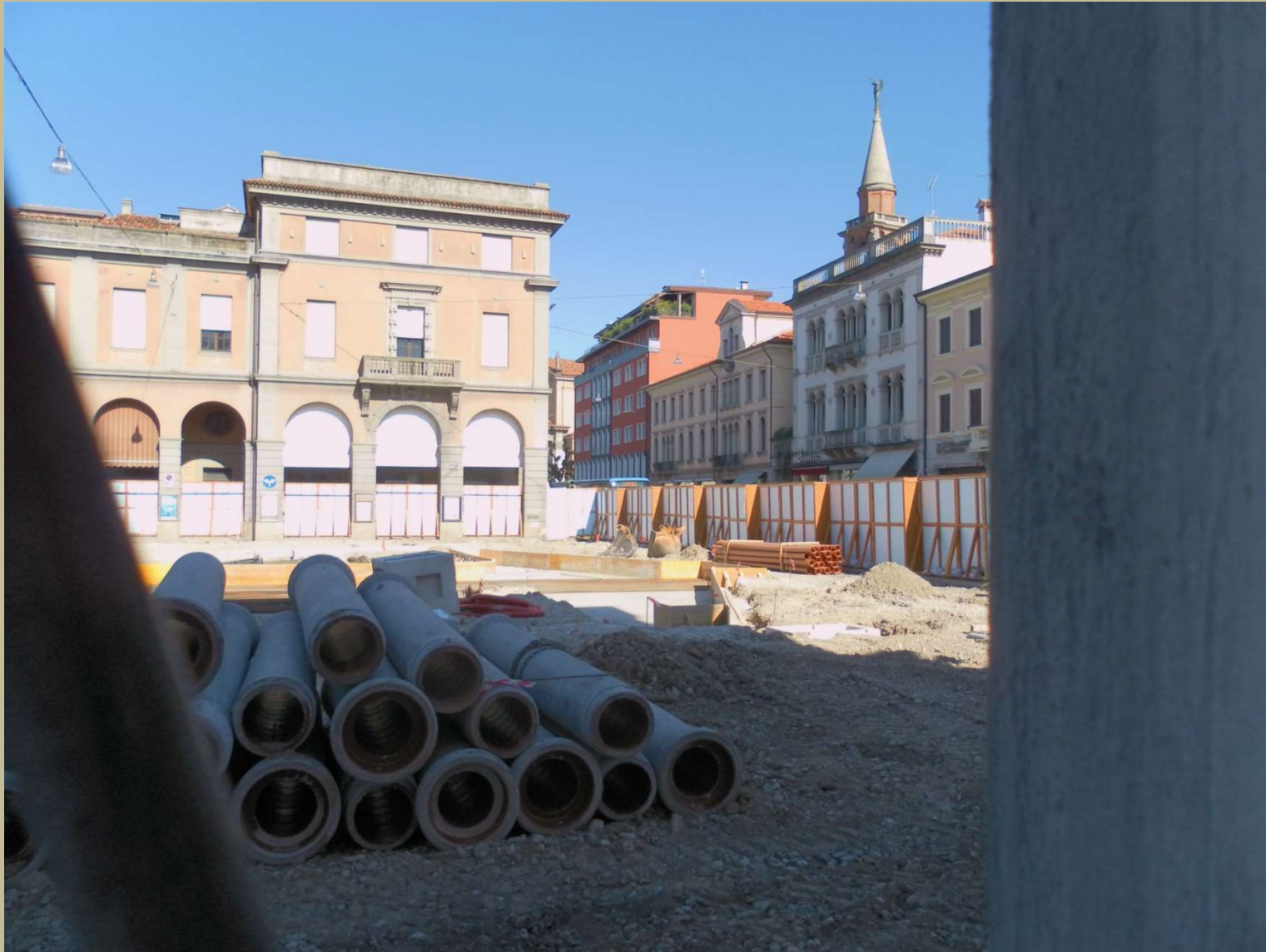
il nuovo posizionamento del monumento inizio delle fondazioni