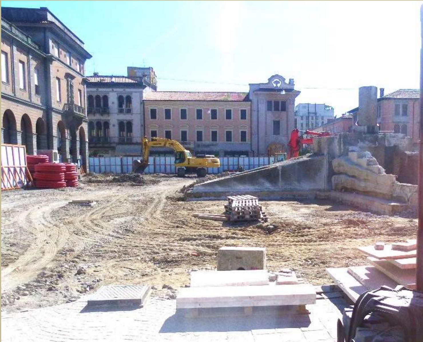
Archivio fotografico club 54 continua l'opera di smontaggio del monumento