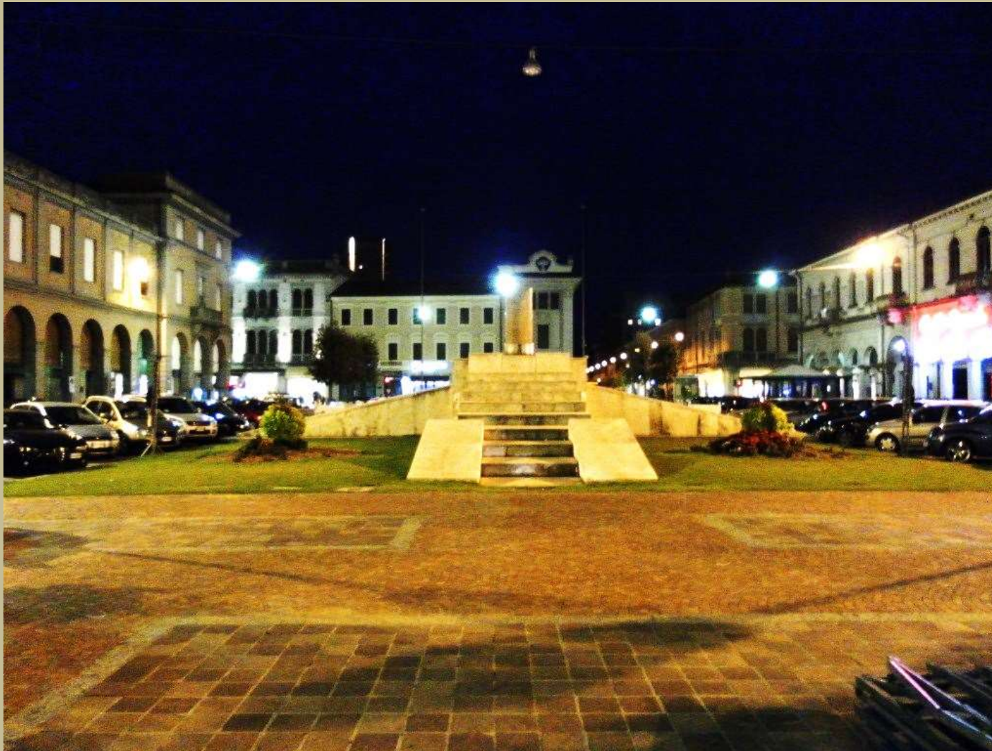
San Donà di Piave piazza Indipendenza di sera 4/9/2011