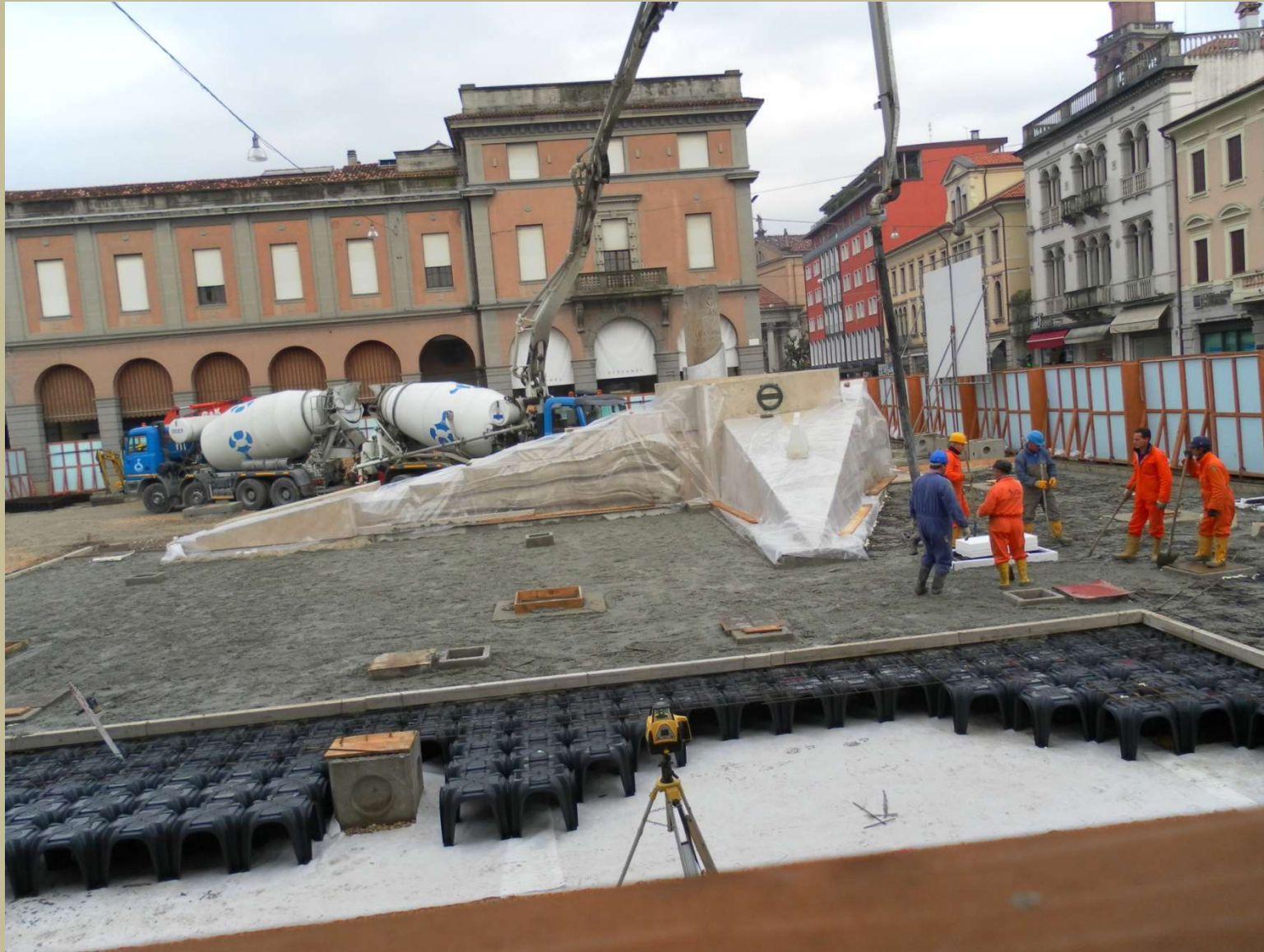
inizio della pavimentazione della piazza