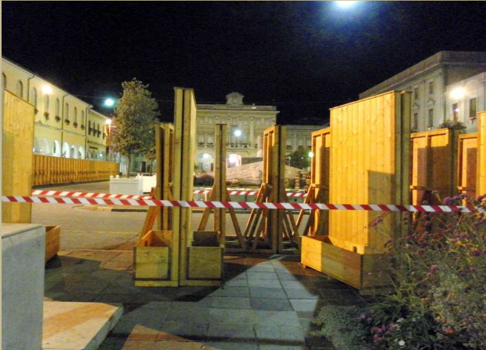
San Donò di Piave piazza Indipendenza completata la recinzione 4/9/2011