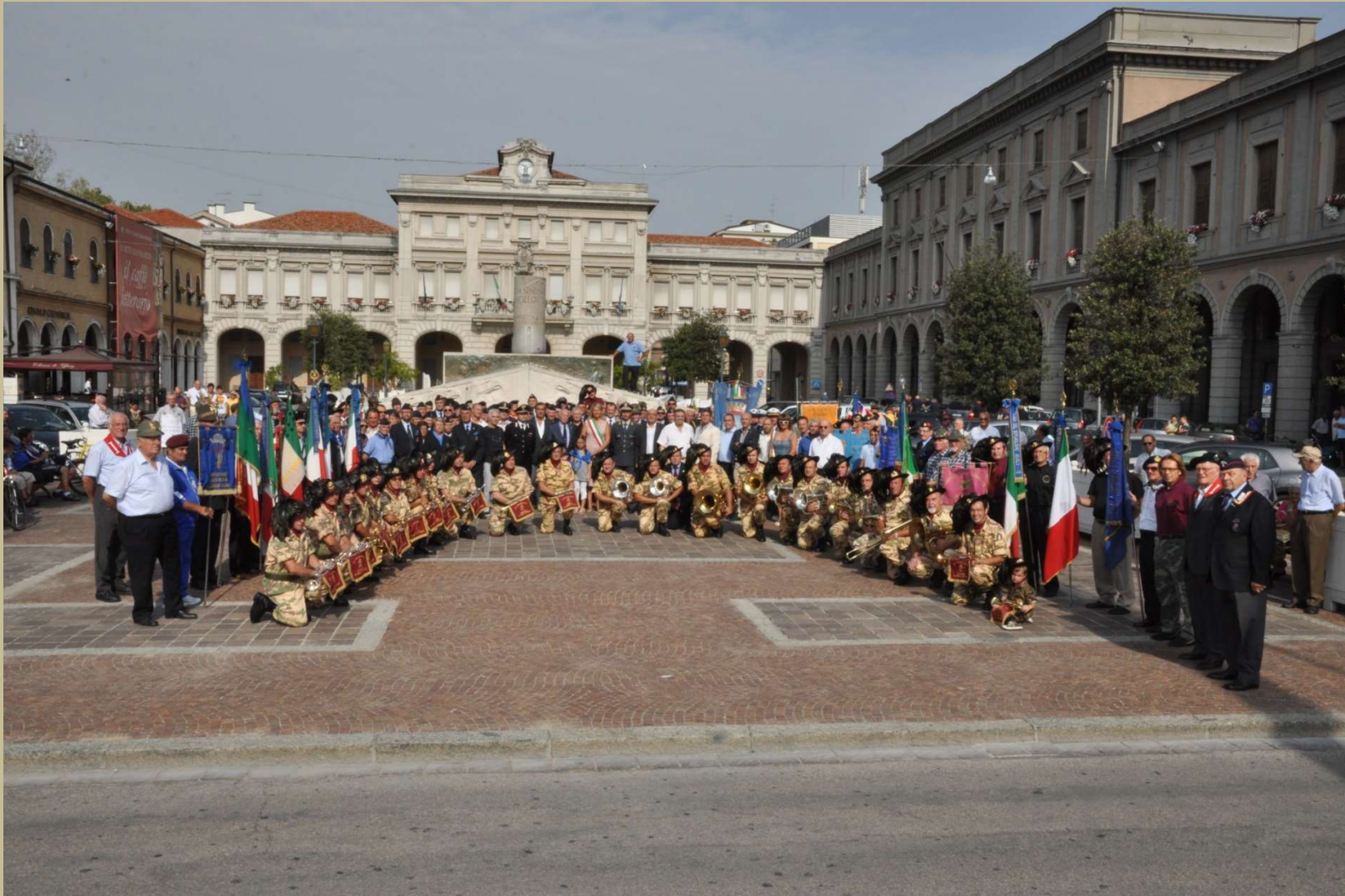
Archivio fotografico club 54 San Donà di Piave piazza Indipendenza un'altra foto ricordo prima dei lavori di rifacimento della pavimentazione e dello spostamento del monumento verso il corso Silvio Trentin il 4/9/2011