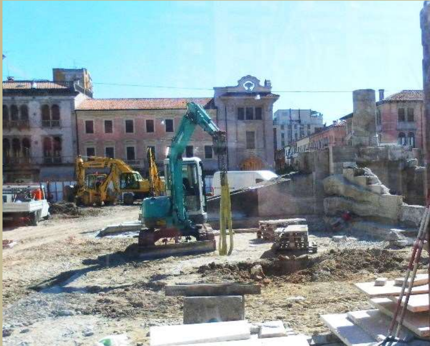
San Donà di Piave piazza Indipendenza inizio lavori di smontaggio del monumento