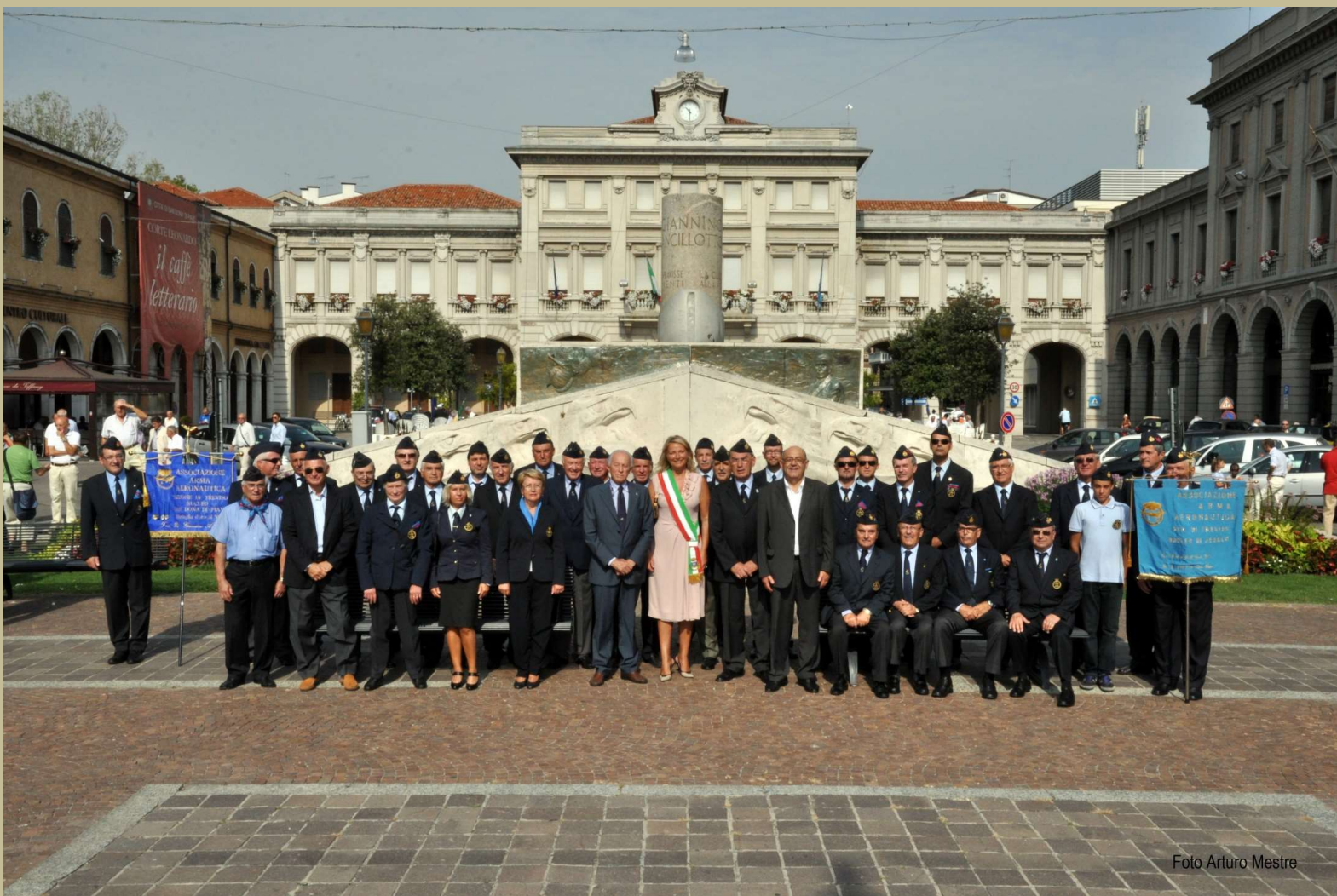
foto ricordo il prima dell'inizio dei lavori di rifacimento della pavimentazione della nuova piazza Indipendenza il 4 settembre 2011