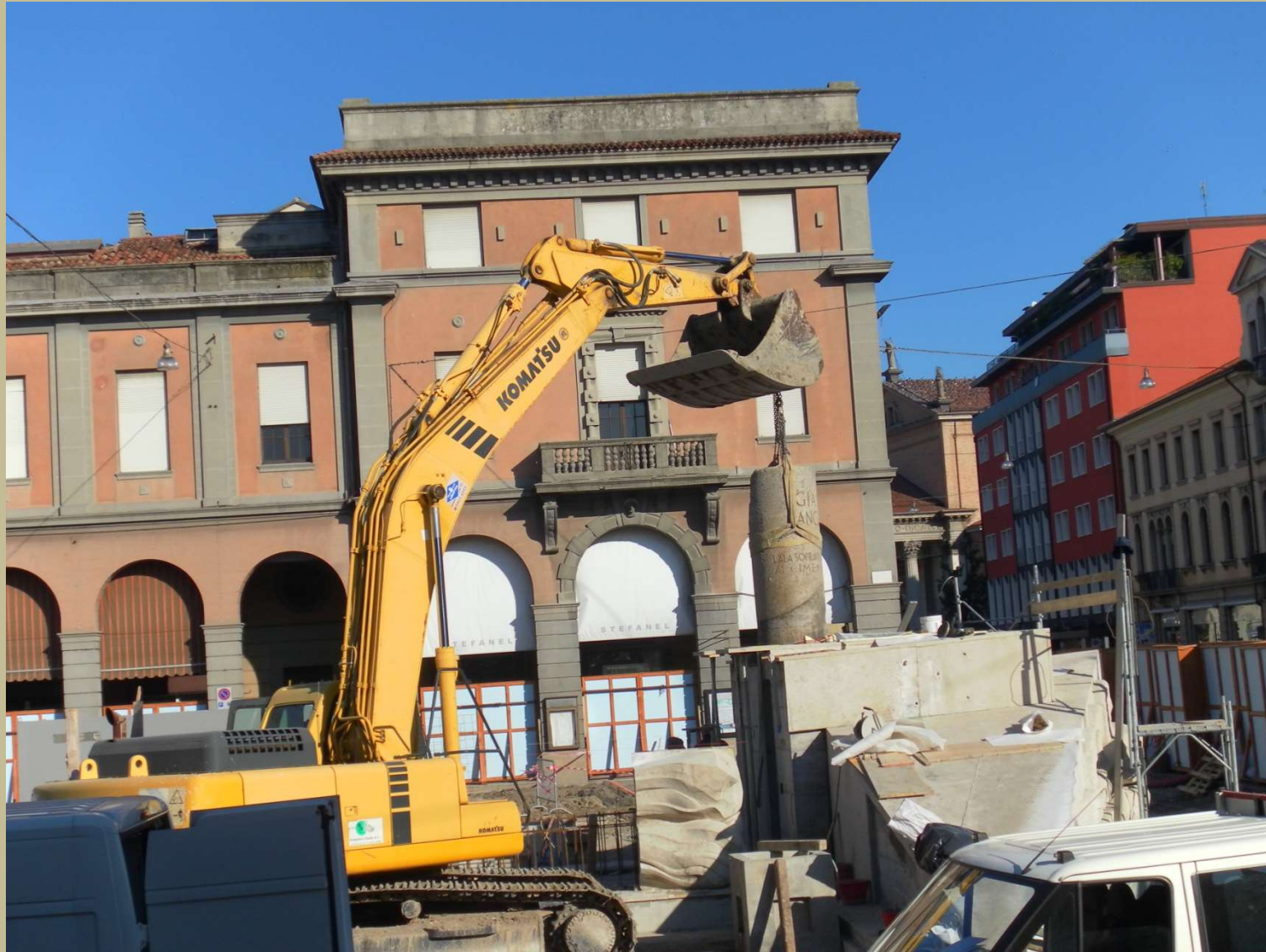
il posizionamento della colonna