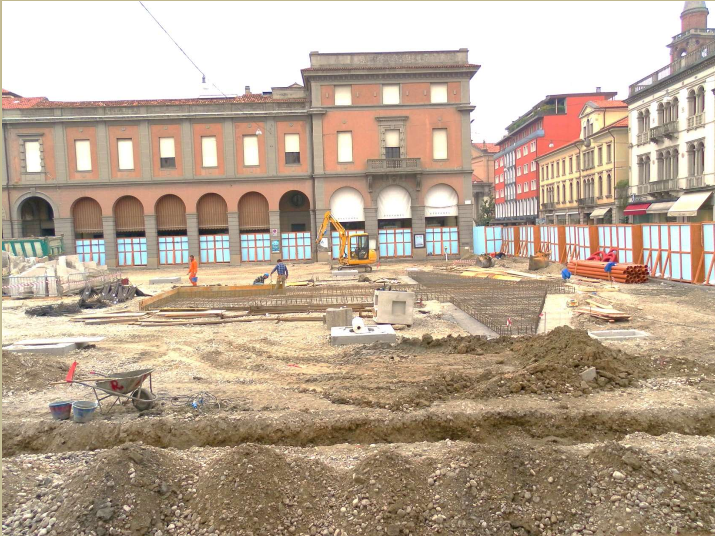
Archivio fotografico club 54 San Donà di Piave piazza Indipendenza il nuovo posizionamento del monumento e la sagoma della base