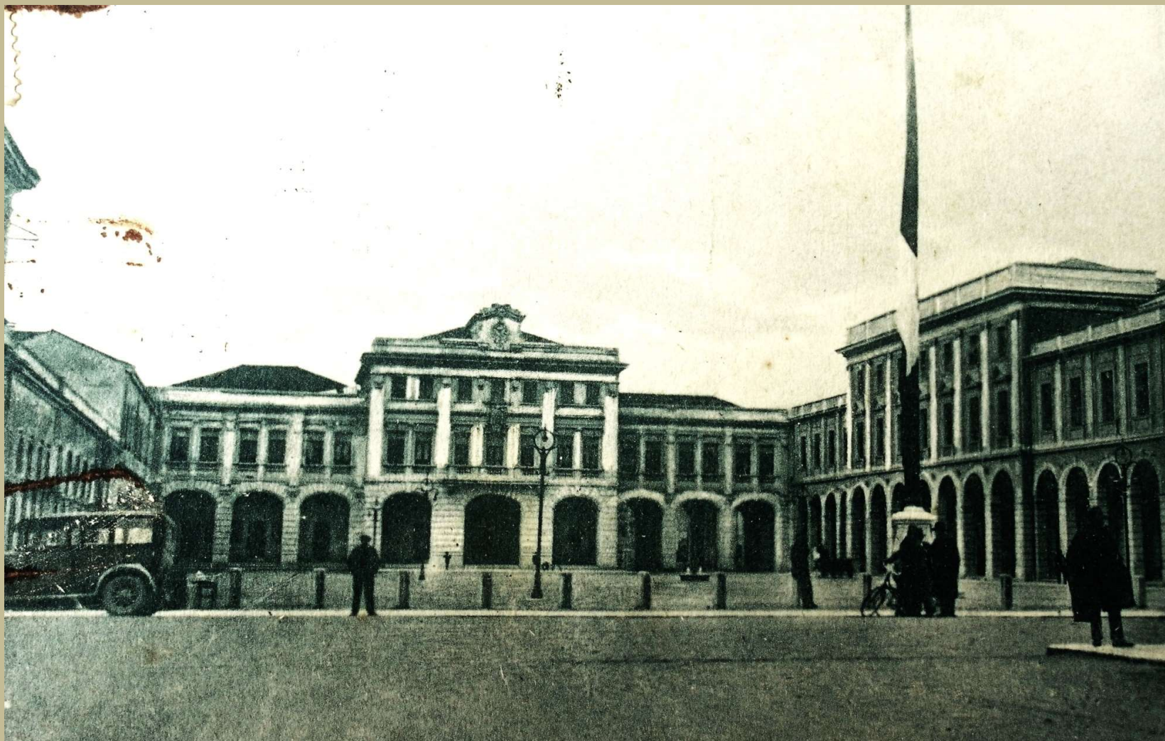
San Donà di Piave piazza Indipendenza nel 1927 vista dal viale dei Tigli ora via Cesare Battisti