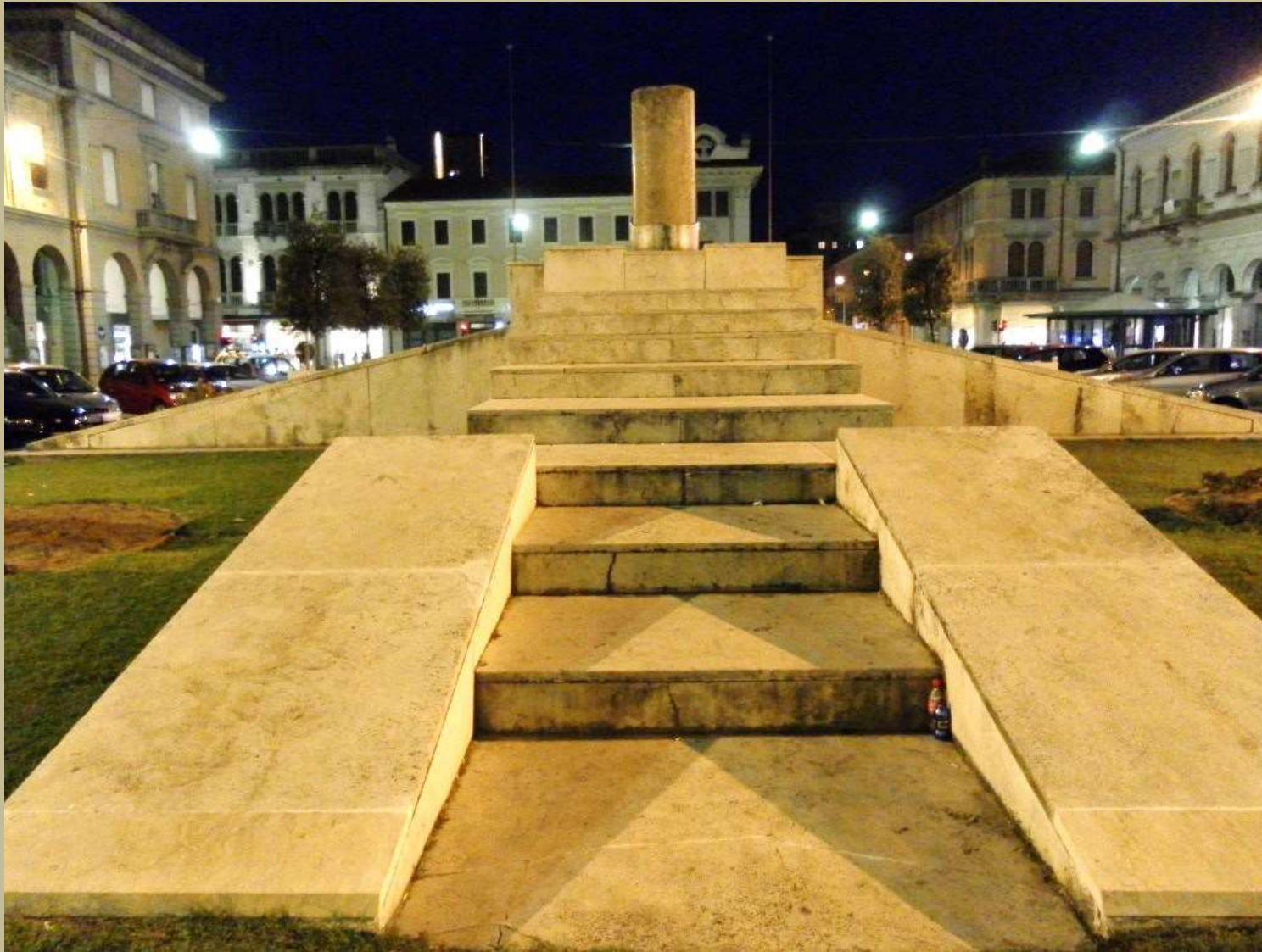
Archivio fotografico club 54 San Donà di Piave piazza Indipendenza particolare del monumento