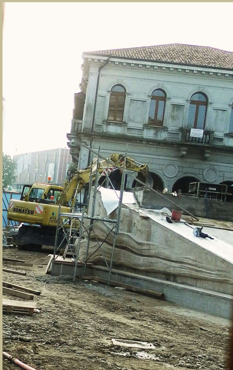
il monumento inizia a prendere forma