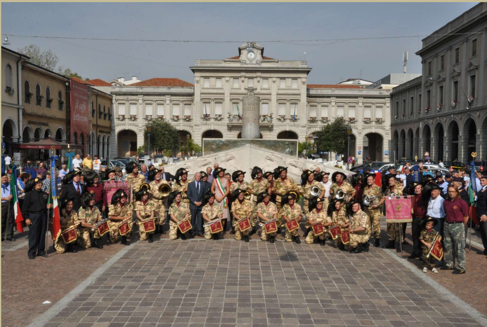
Archivio fotografico club 54 San Donà di Piave piazza Indipendenza foto ricordo della fanfara dei bersaglieri prima dei nuovi lavori di ristrutturazione della piazza 4/9/2011