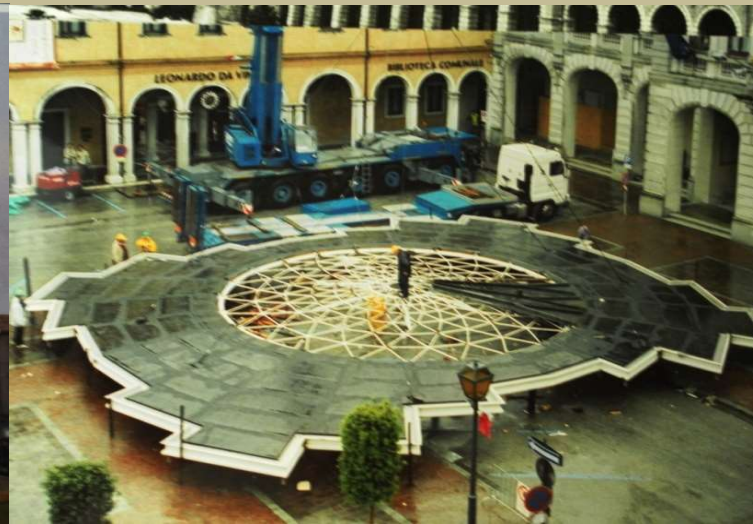
Archivio fotografico club 54 San Donà di Piave momenti della piazza Indipendenza