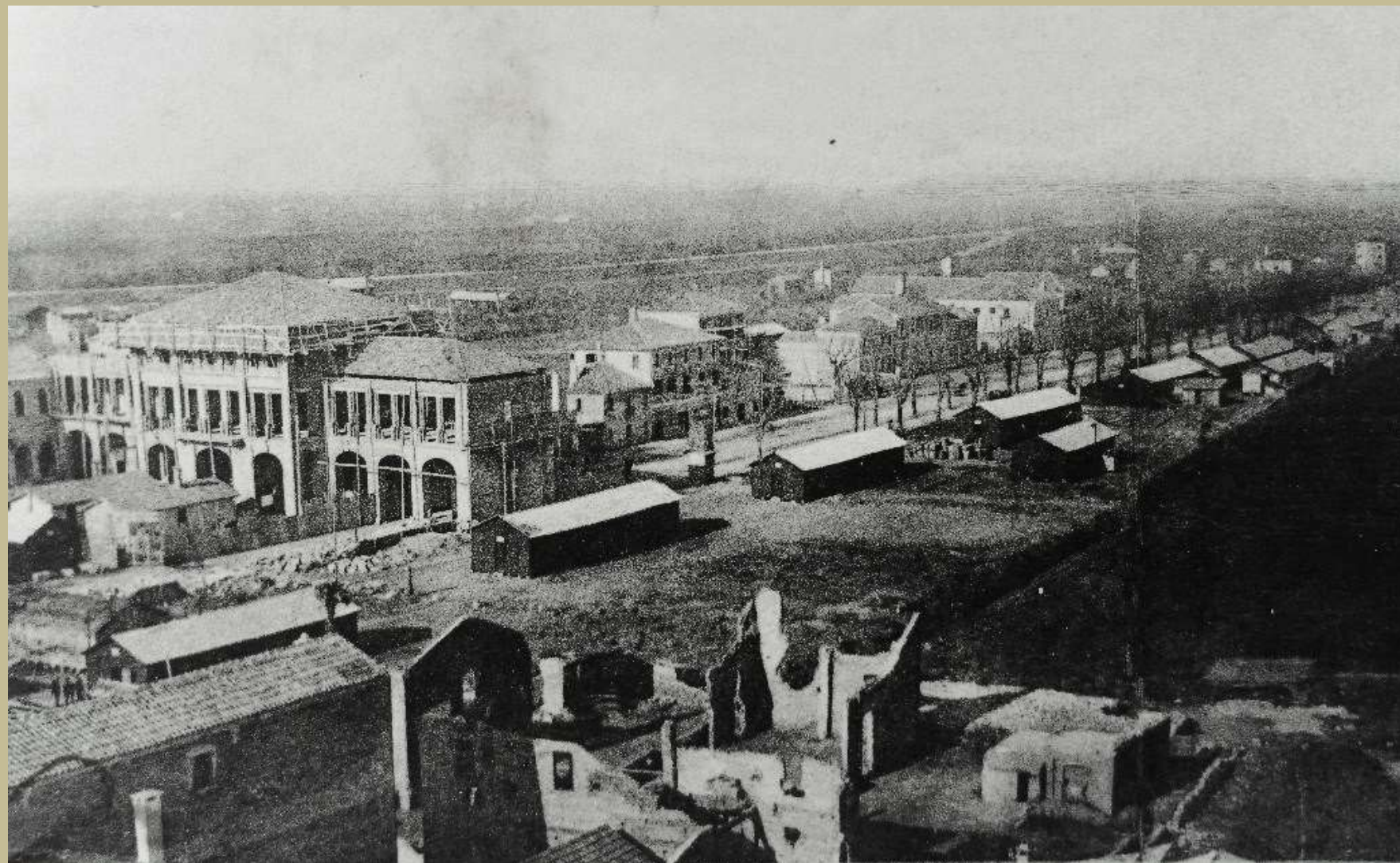
San Donà di Piave piazza Indipendenza nel 1919 la ricostruzione del municipio e della piazza dalle rovine del conflitto 1915 /1918