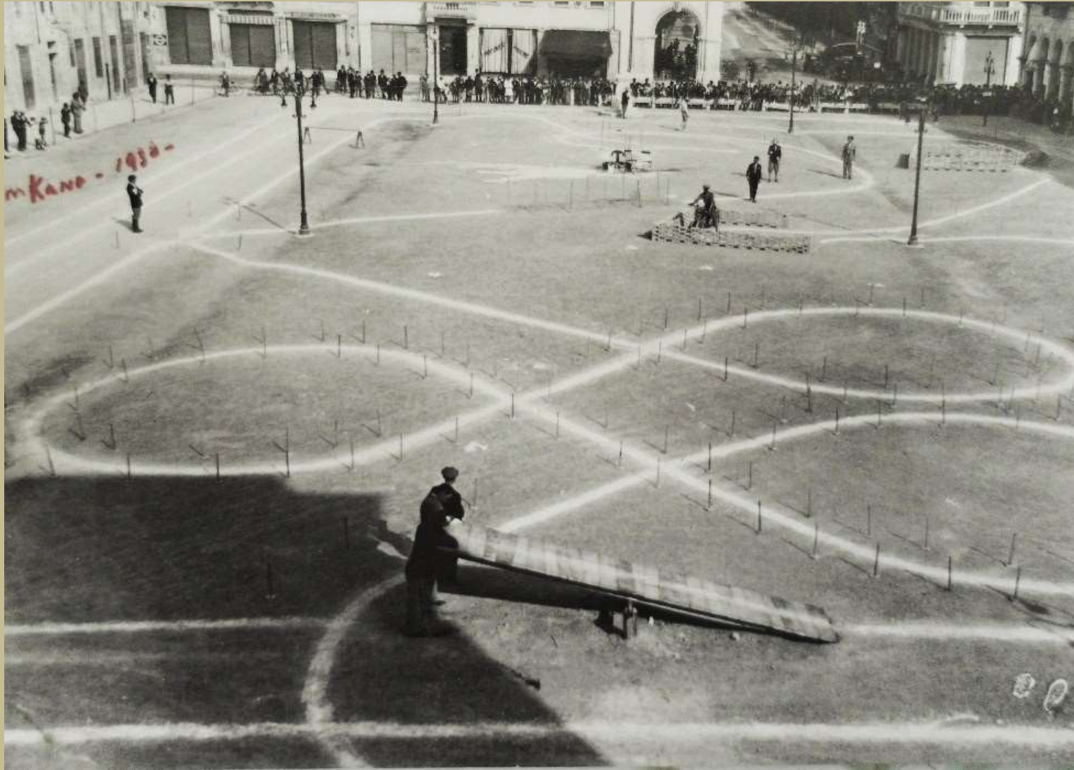
Archivio fotografico club 54 San Donà di Piave piazza indipendenza nel 1930 allestita per una gimcana motociclistica