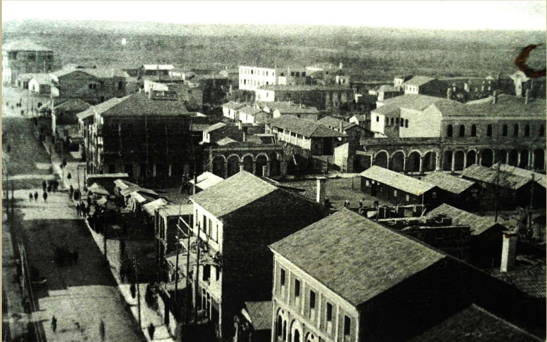
Archivio fotografico club 54 San Donà di Piave la ricostruzione dei fabbricati di piazza Indipendenza e della via Maggiore ora corso Silvio Trentin nel 1920