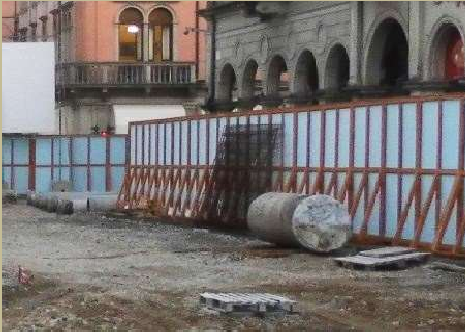
Archivio fotografico club 54 continua lo smontaggi del monumento la colonna centrale parcheggiata al lato della piazza