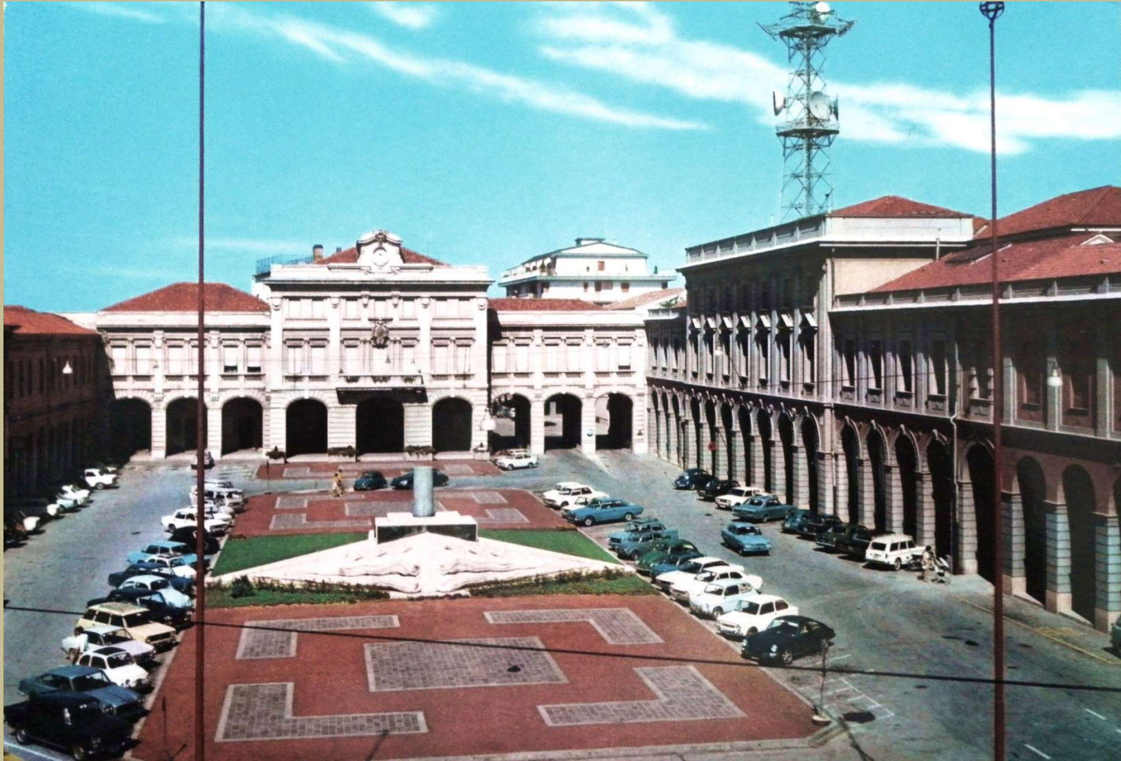
Archivio fotografico club 54 San Donà di Piave Piazza Indipendenza nel 1970