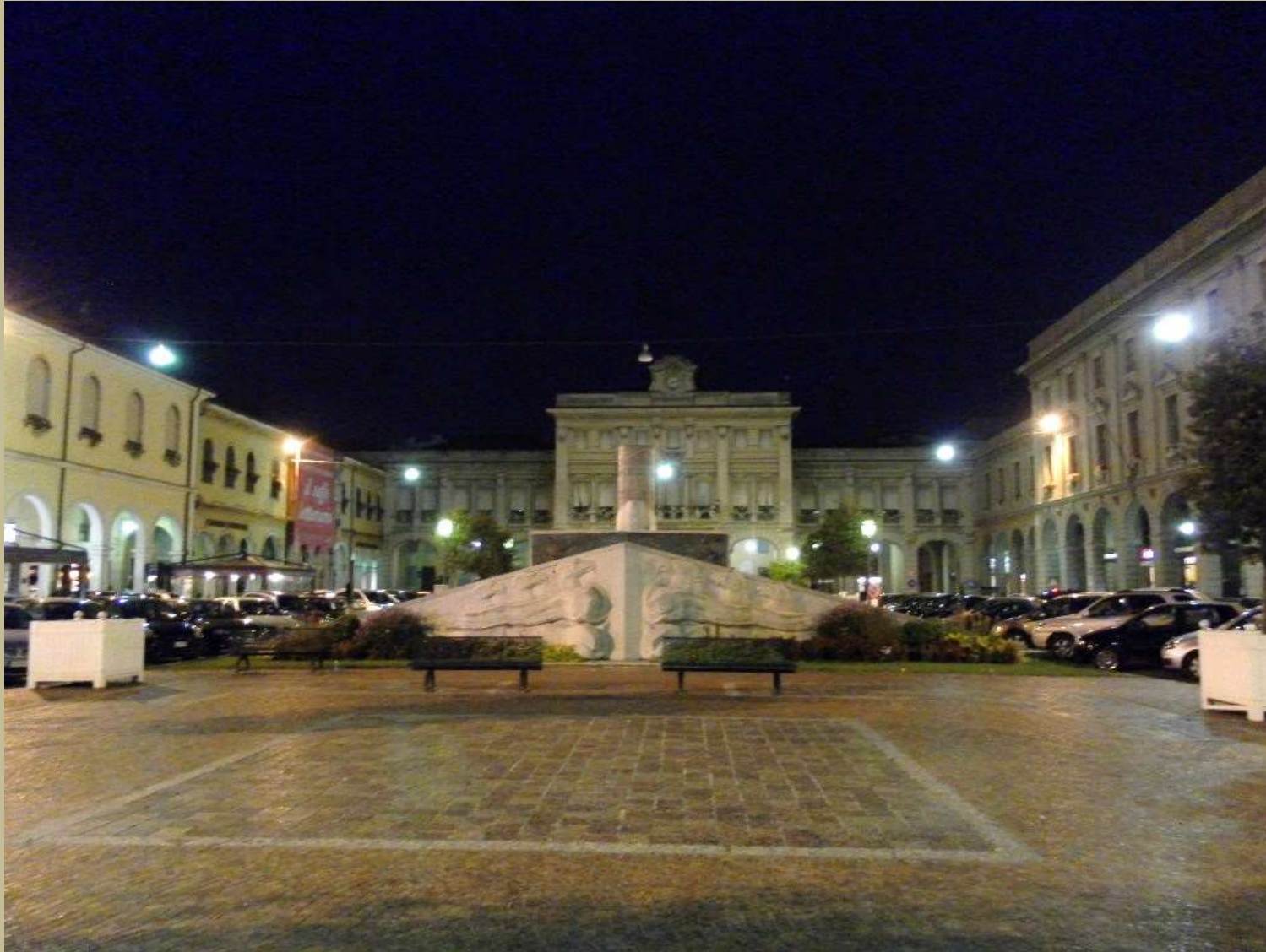
Archivio Fotografico club 54 San Donà di Piave piazza Indipendenza di sera 4/9/2011