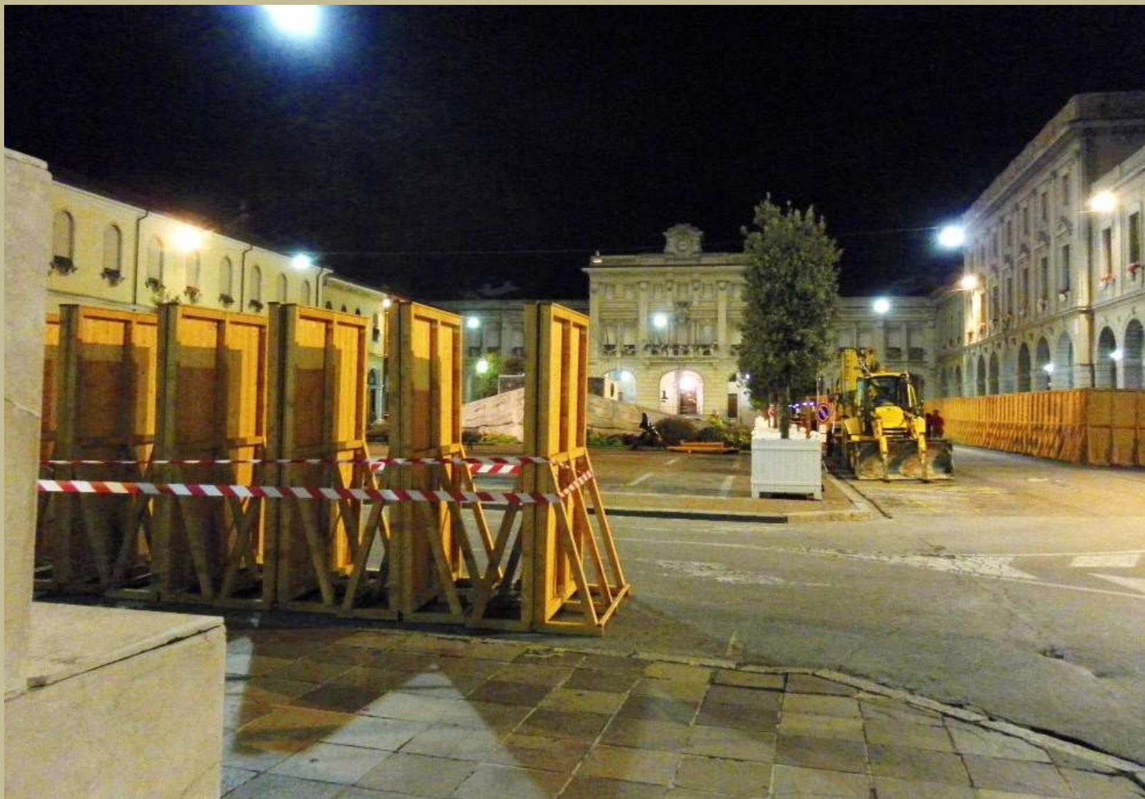
Archivio fotografico club 54 San Donà di Piave piazza Indipendenza la recinzione di inizio lavori 4/9/2011