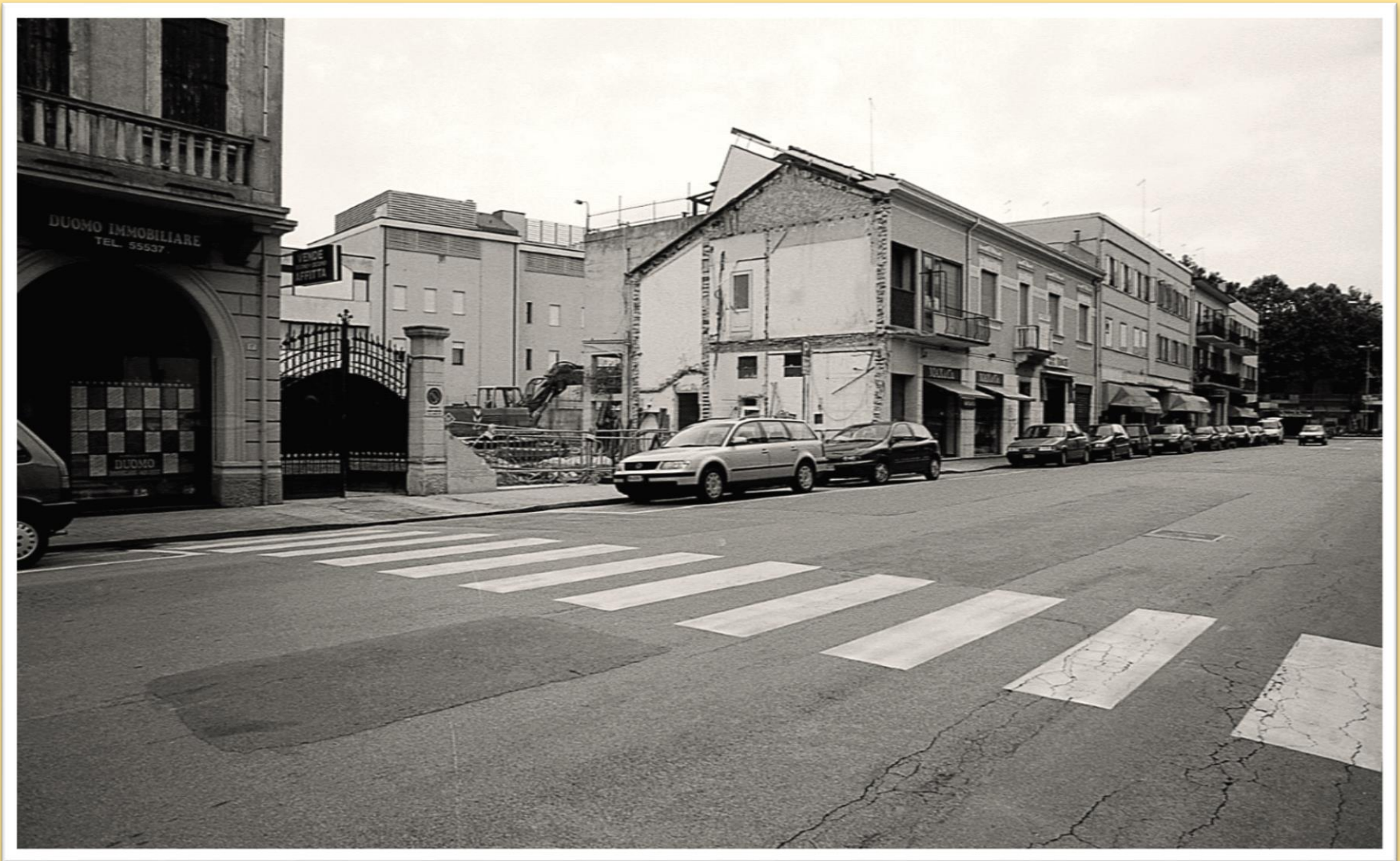
1998 demolizione degli immobili della proprietà "Bimbi"