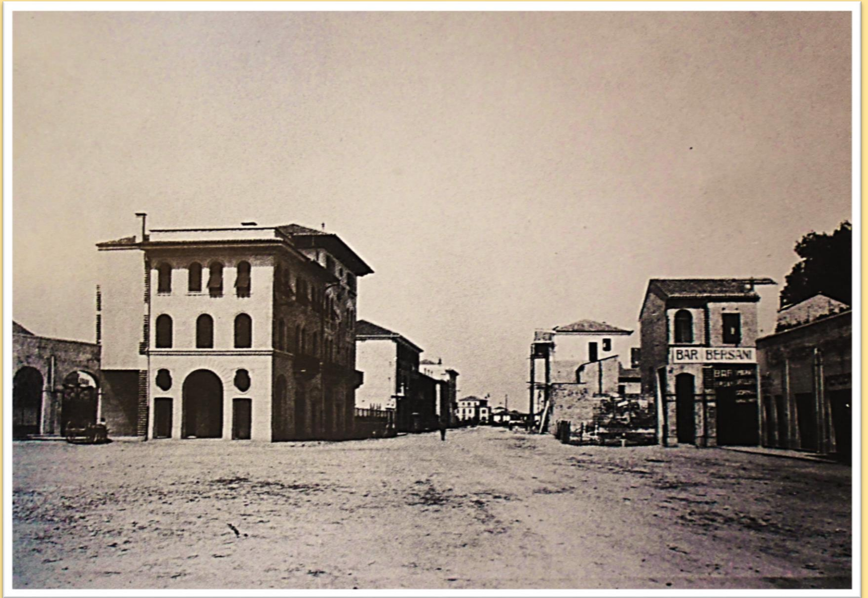
1930 La nuova piazza Trevisan e la via G. Ancillotto