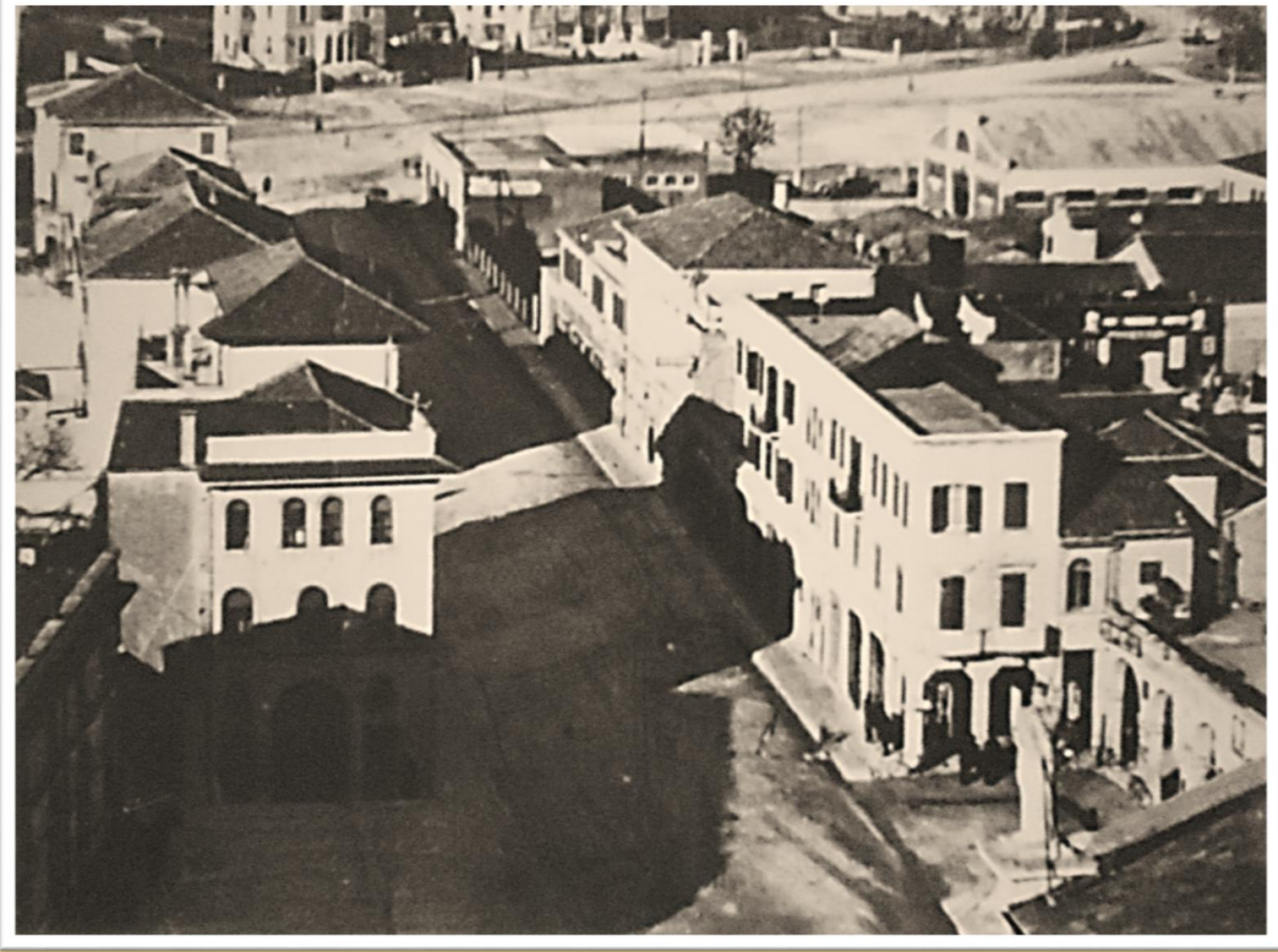
1935 PIAZZA TREVISAN E VIA G. ANCILLOTTO (panoramica dal campanile del duomo)