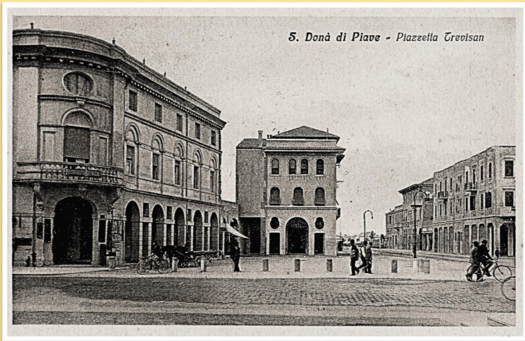
1935 la nuova piazza Trevisan con la via G. Ancillotto il particolare la strada era in grosso porfido non ancora asfaltata