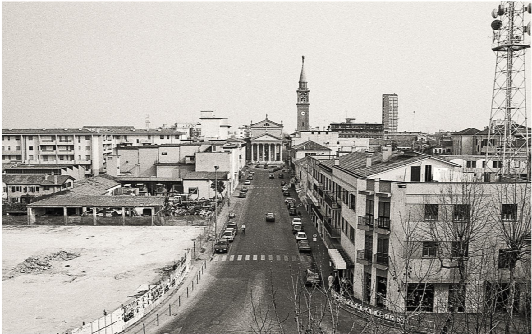
1991/92 Via G. Ancillotto angolo con piazza Quattro Novembre, la demolizione del Consorzio Agrario Provinciale e far posto al nuovo complesso "Europa"