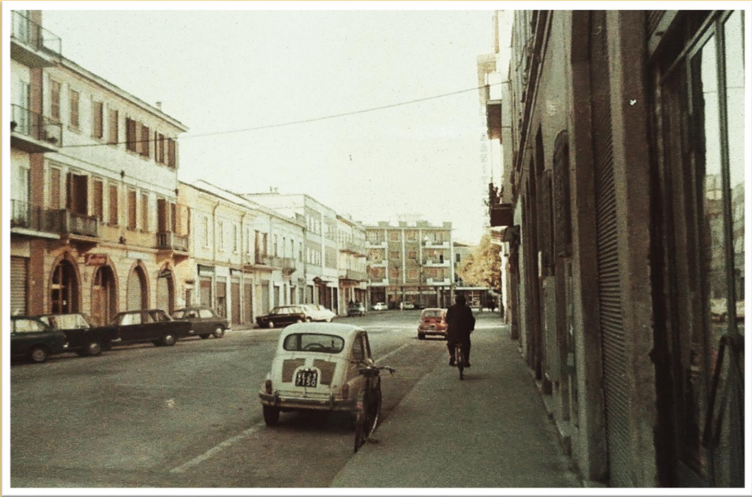
1968 via G. Ancillotto si intravede l'entrata del cinema Progresso