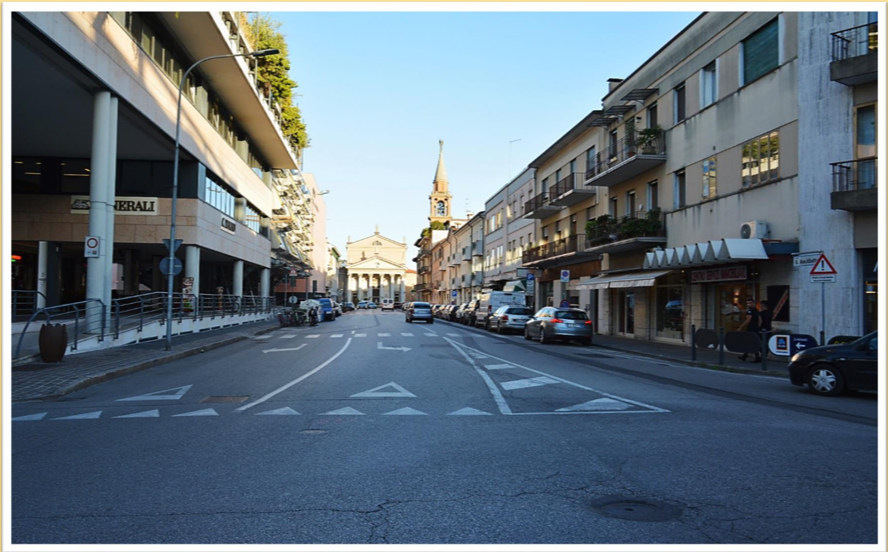
2019 la via G. Ancillotto vista da piazza Quattro Novembre