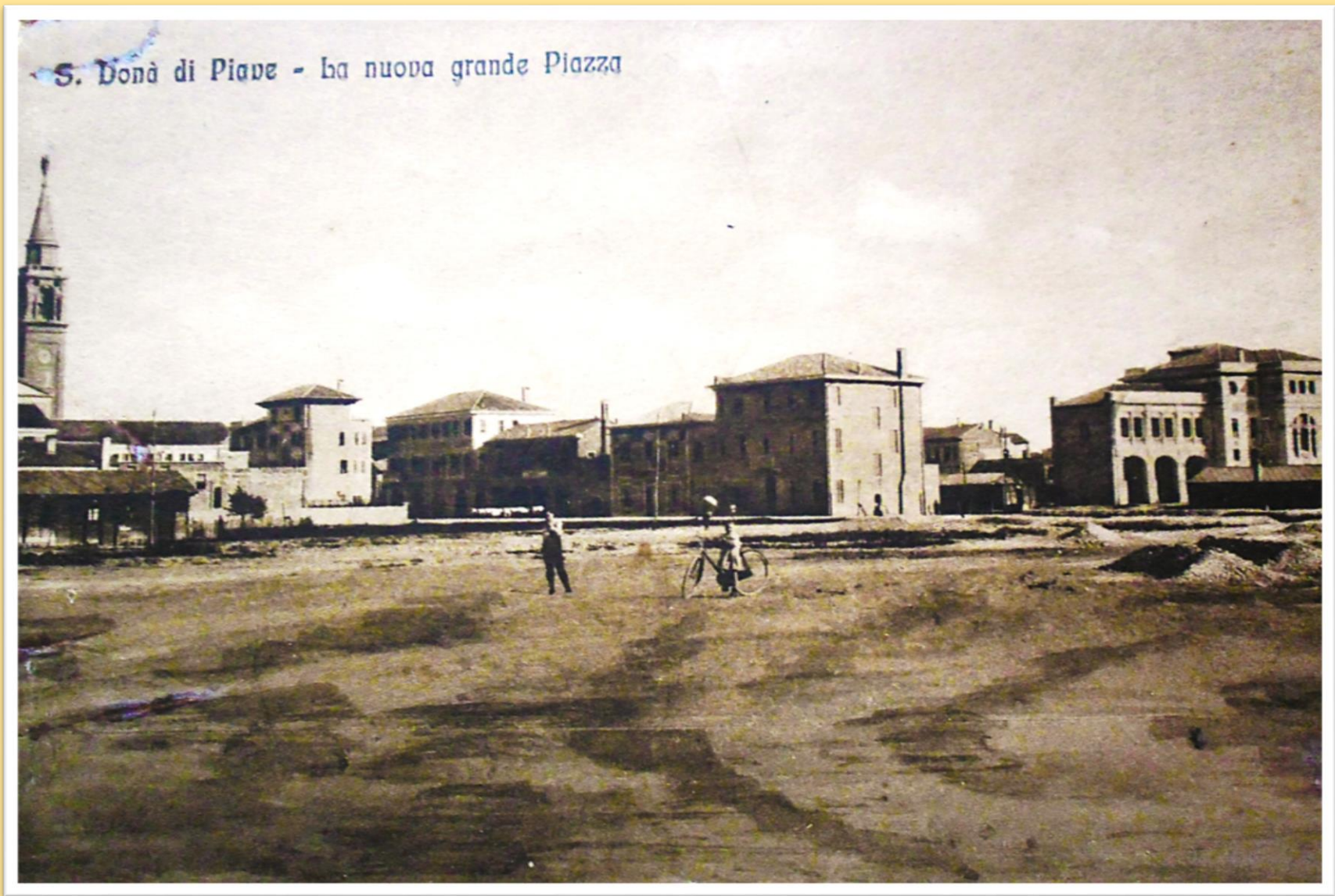
1930 LA NUOVA PIAZZA QUATTRO NOVEMBRE sullo sfondo via G. Ancillotto