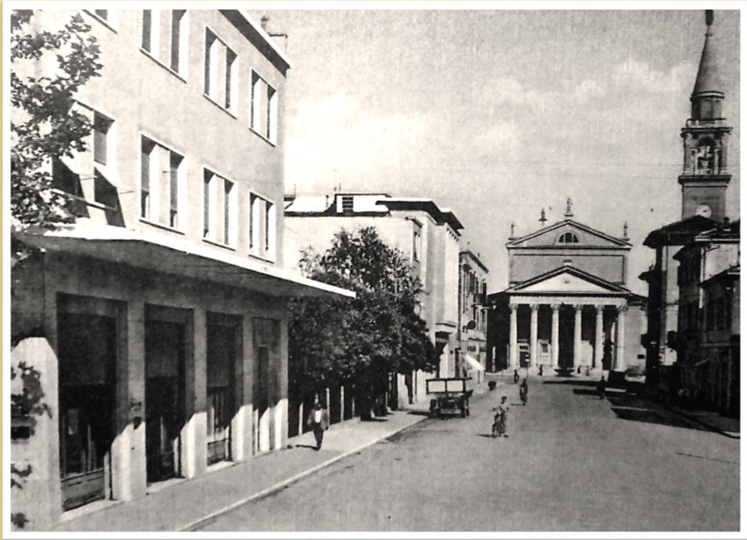
1958 via G. Ancillotto in primo piano il Consorzio Agrario Provinciale