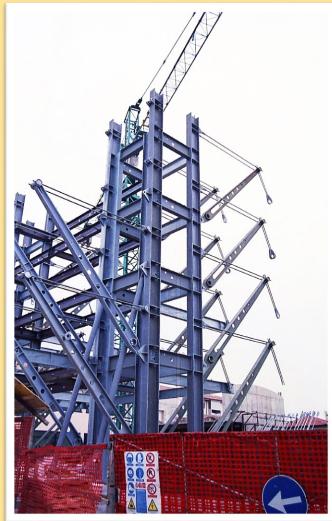
IL PALAZZO ASTRA IN COSTRUZIONE 1997