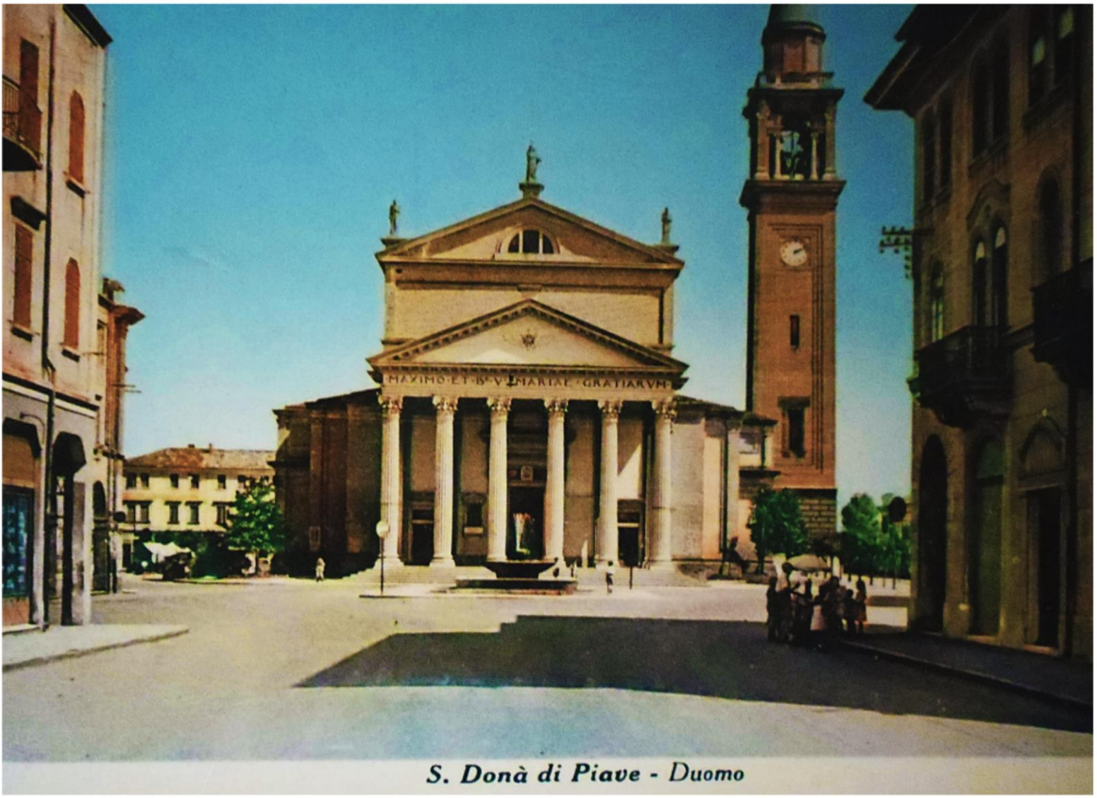
1950 via G. Ancillotto un particolare sul marciapiedi a sinistra el caretin dei geati e dee creme de Battistin