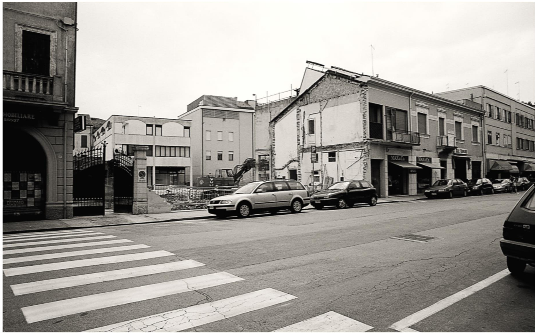
Demolizione degli immobili della proprietà Bimbi 1998