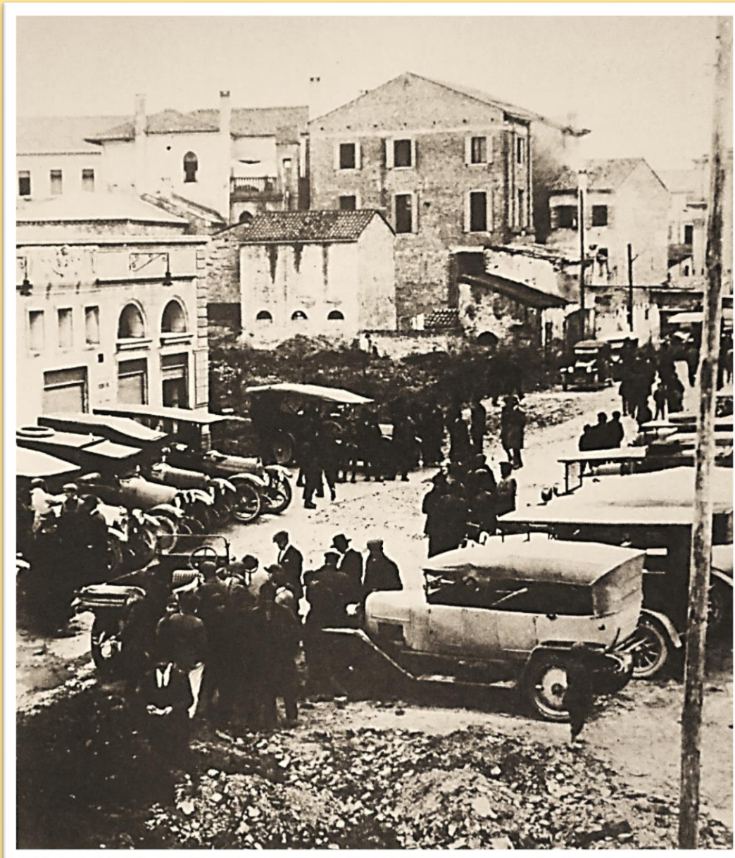
Congresso delle bonifiche in via G. Ancillotto nel 1922