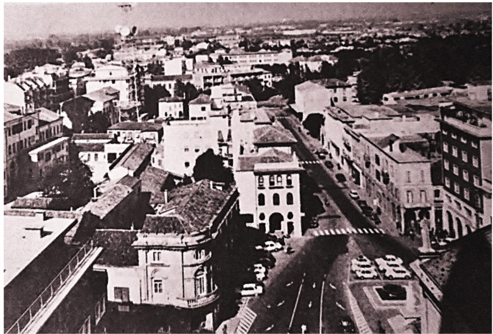
1970 la piazza Trevisan e la via G. Ancillotto foto dal campanile del duomo