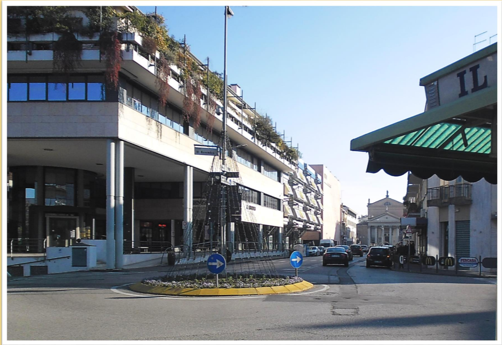
Via G. Ancillotto nel 2019 prima dell'intervento sul nuovo arredo urbano e sulla viabilità