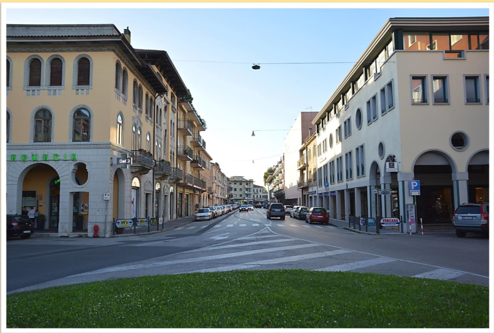
La via G. Ancillotto nel 2019