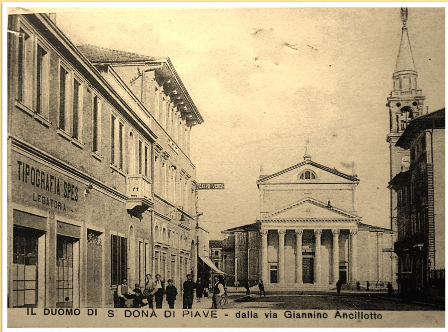
1930 la tipografia SPES e il Teatro Verdi