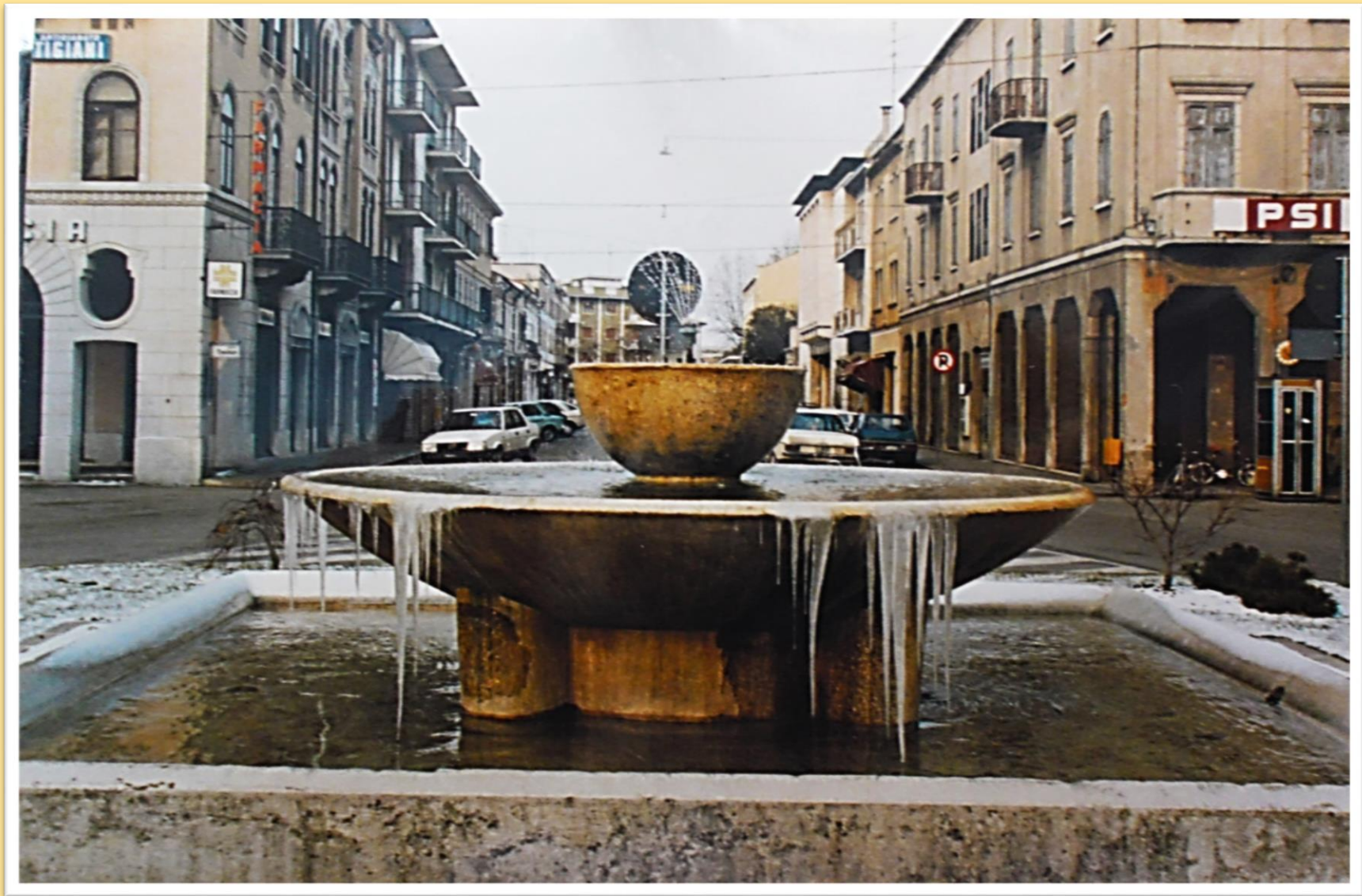
1980 la fontana di piazza Trevisan in primo piano e la via G. Ancillotto