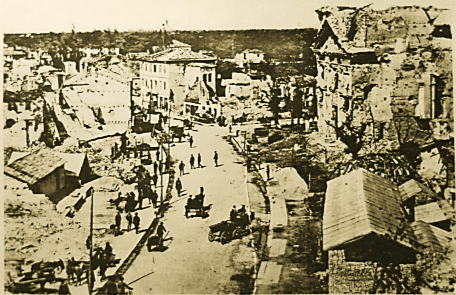
S. Donà di Piave - Rovine della grande guerra 1915 1918 - Chiesa Arcipretale