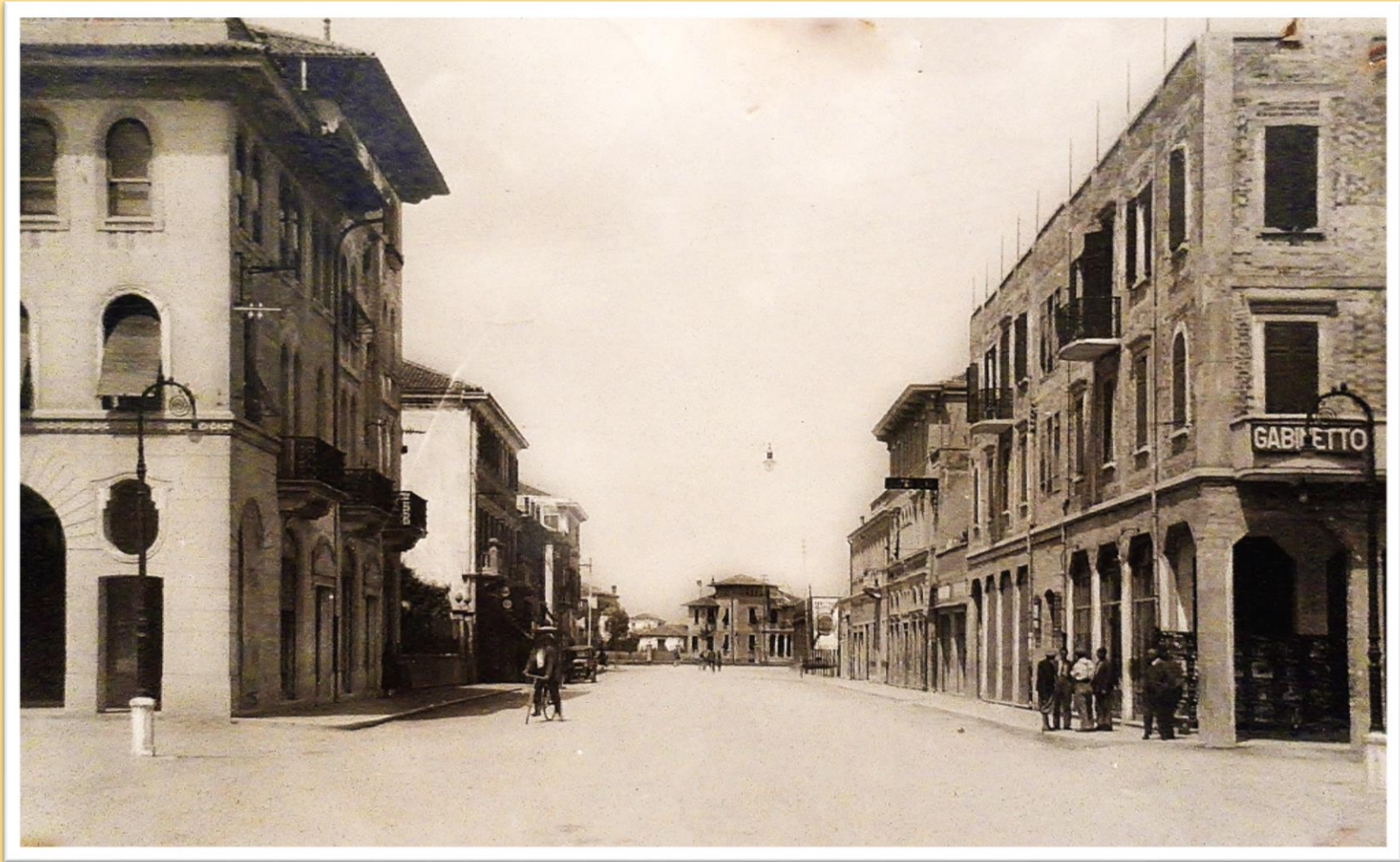
1937 La via G. Ancillotto vista da piazza Trevisan in terra battuta l'asfalto arriverà anni dopo