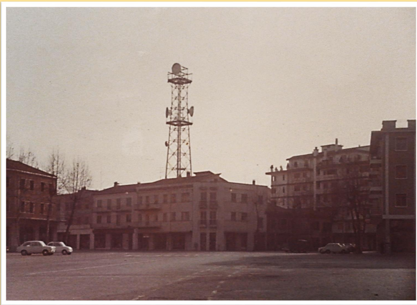
1969 piazza Quattro Novembre o dee corriere