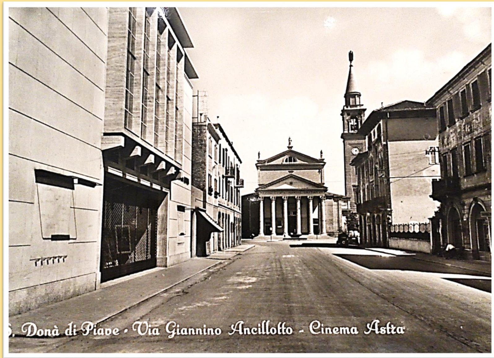
S. Donà di Piave - Via Giannino Ancillotto - Cinema Astra