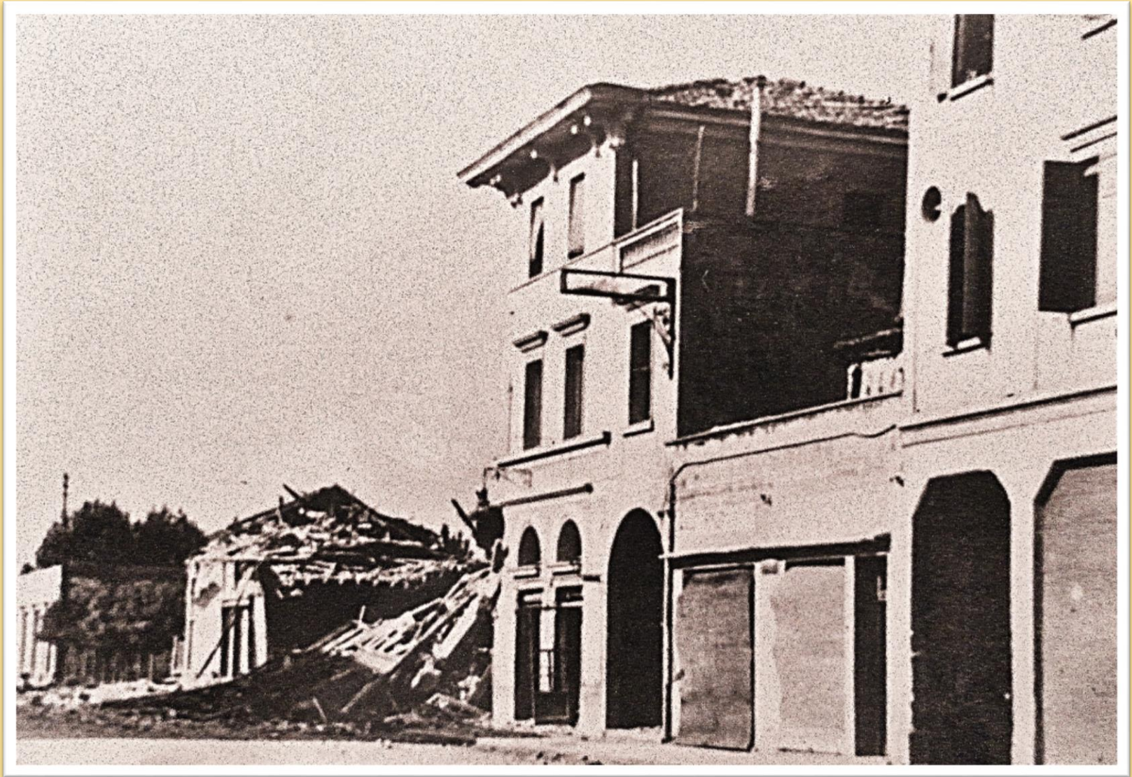
Il Teatro Verdi bombardato e distrutto nell'ottobre del 1944 in via G. Ancillotto