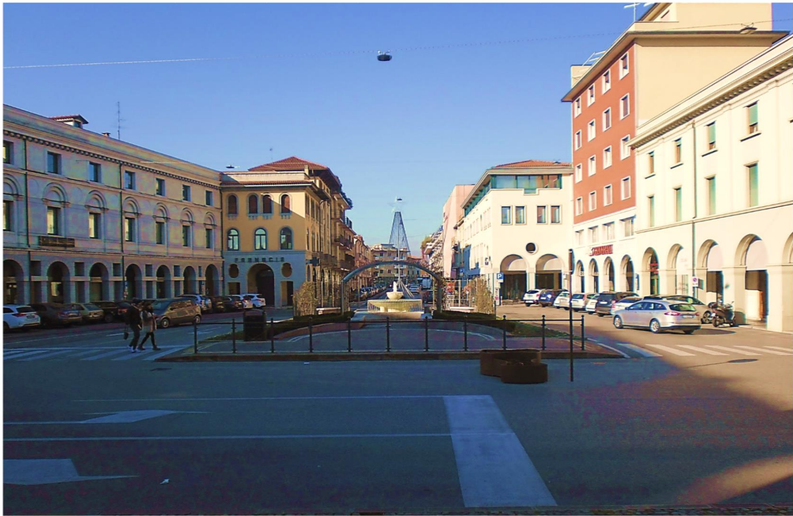
2019 la Piazza Trevisan aperta su Via Ancillotto